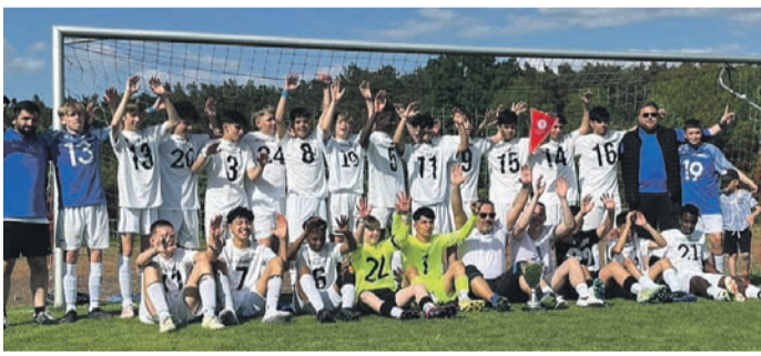
Das Bild zeigt die erfolgreiche C1 des SVM.