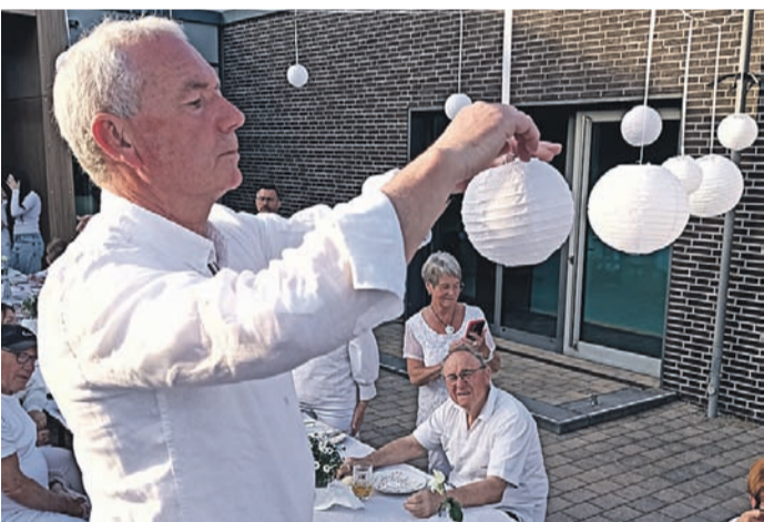
Der Platz vor der Bürgerhalle wurde mit vielen Hilfsmittel ganz in Weiß getaucht.

zum „Handkäs mit Musik“ evident. Das Diner en blanc untermalte DJ Ax musikalisch, am Schluss wurde sogar getanzt. Seit 34 Jahren besteht mittlerweile der Kontakt nach Frankreich und beruht auf einer Vielzahl von Treffen und Anekdoten. Zu letzteren zählt etwa der große Riss einer Hose ausgerechnet am Hinterteil, was durch Bücken bei einem Diner en blanc passierte. „Mal die Ärzte ausgenommen - wann tragen Männer eine weiße Hose?“, lautete damals die völlig verständliche Erklärung des Eppertshäuser Pechvogels.