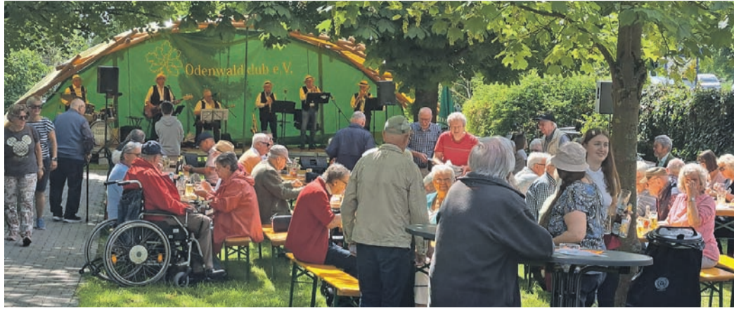
Ein besonderer Blickfang bot dabei der imposante Da-Vinci-Bogen, eine selbsttragende Konstruktion, die als Bühne genutzt wurde.

Blauer Himmel, angenehme Temperaturen machte schon am Vortag den umfangreichen Aufbau im Pfarrgarten einfach. Und so ging alles leicht von der Hand – auch das große Zelt wurde überflüssig. Die eingespielte Mannschaft baute die Kuchentheke, und die Grill- und Getränkestation auf und wie geplant konnten die Kerb-Dixie-Stomper aus Groß-Zimmern um 11 Uhr zum Frühschoppen aufspielen. Flotte Südstaaten Jazz Rhythmen ertönten, Braten- und Bratwurstduft durchströmten den altherwürdigen Pfarrgarten. Frittierte Champignons, der Renner seit vielen Jahren auf dem Traditionsfest und natürlich die Fritten fanden wie gewohnt ihre Abnehmer. Viele