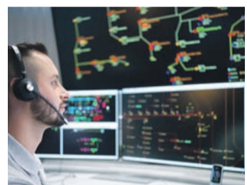
Schaltmeister in der zentralen Leitwarte der E-Netz Südhessen in Darmstadt.