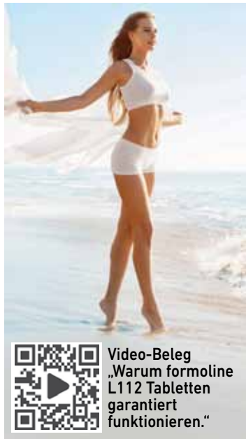
Video-Beleg „Warum formoline L112 Tabletten garantiert funktionieren.“

Starke Hilfe zum Abnehmen durch Studien belegt Das bewährte Schlankheitsmittel aus der Apotheke – formoline L112 – ist das einzige Medizinprodukt zum Abnehmen mit