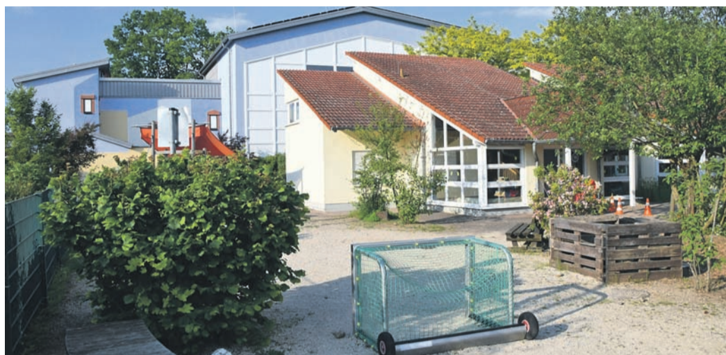
Hotspot der Kinderbetreuung in Münster: vorn das „Haus der Kinder“, hinten das stillgelegte Hallenbad, in dem interimweise die Kita „Sonnenblume“ untergebracht ist. Unter anderem in diesen beiden Einrichtungen wird es für Münsterer Familien teurer.

Obwohl der Beschluss fürs Sicherungskonzept vor wenigen Wochen schon zusammen mit der Verabschiedung von Etat und Investitionsplan mehrheitlich beschlossen worden war, hätten die Gemeindevertreter den Anstieg der Elternbeiträge am Montag noch verhindern können. Doch nur SPD und ALMA-Die Grünen ließen ihrem Bedauern, junge Familien