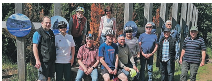
Nach der Stärkung in der Mittagspause im Restaurant „zum Stern“, wurde die Rückfahrt über Waldacker, Eppertshausen und Münster nach Altheim angetreten. Die Sportler bewältigten eine Strecke von rund 40 Kilometer.