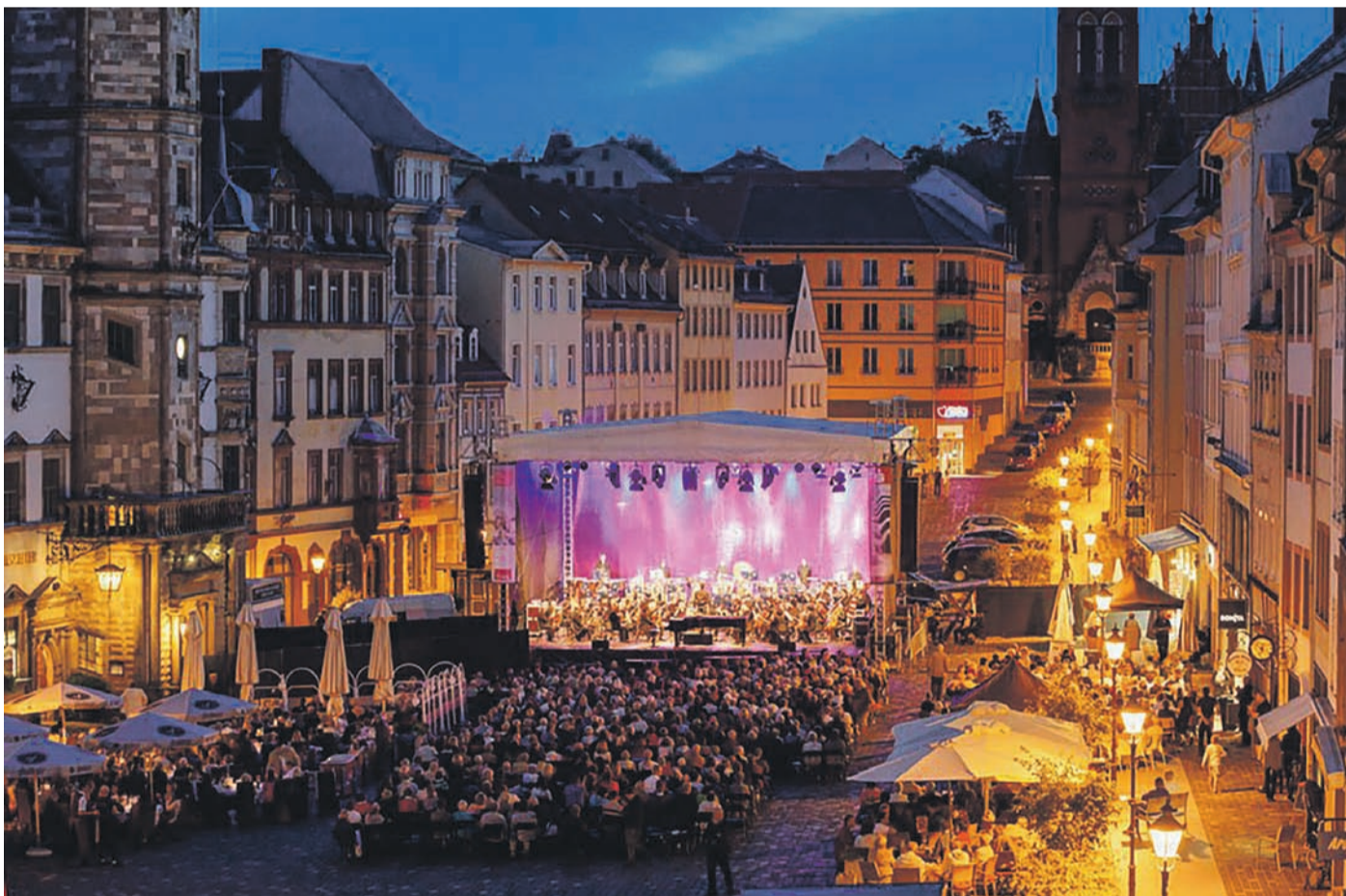
Das stimmungsvolle Open-Air-Konzert des Philharmonischen Orchesters Altenburg Gera auf dem Altenburger Marktplatz steht in diesem Jahr unter dem Motto „O Sole Mio – eine neapolitanische Nacht“.

(djd). Herausragende Kulturschätze, kulinarische Köstlichkeiten und handwerkliche Traditionen prägen das Altenburger Land, in Thüringen unweit der sächsischen Städte Leipzig und Chemnitz gelegen.