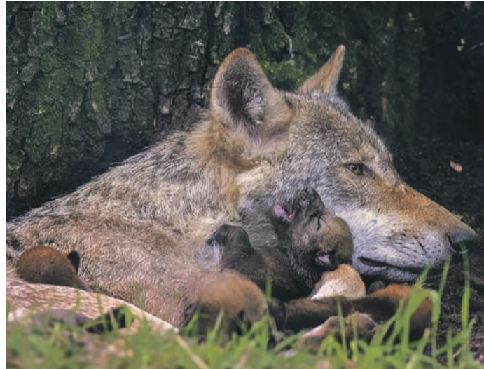
Das Team des Wildparks freut sich auf zahlreiche Besucher, die sich an dem unerwarteten Nachwuchs erfreuen.

Freudige Überraschung im Europäischen Wolfsrudel des Wildparks „Alte Fasanerie“