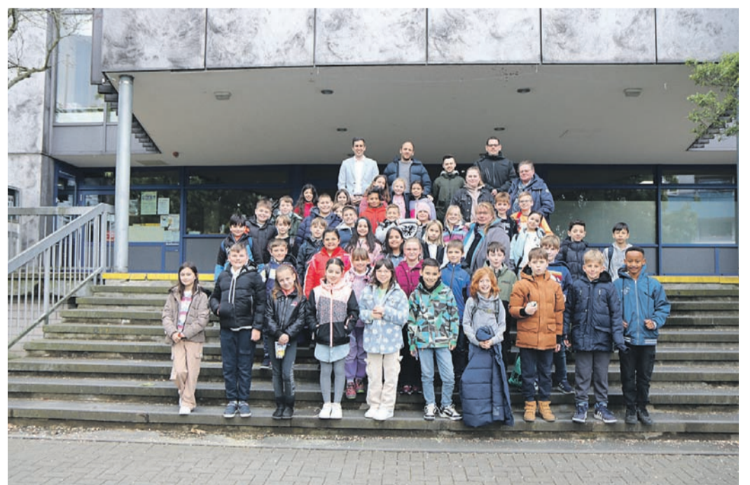
Zur zweiten Besuchsgruppe der Waldschule im Rathaus an der Schubertstraße zählten die Schülerinnen und Schüler der Klassen 3c und 3e.