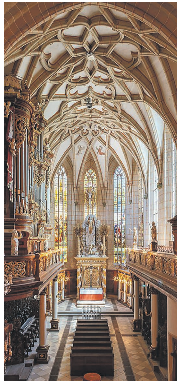
Die Schlosskirche des Altenburger Residenzschlusses ist Schauplatz der Internationalen Sommerorgelkonzerte.