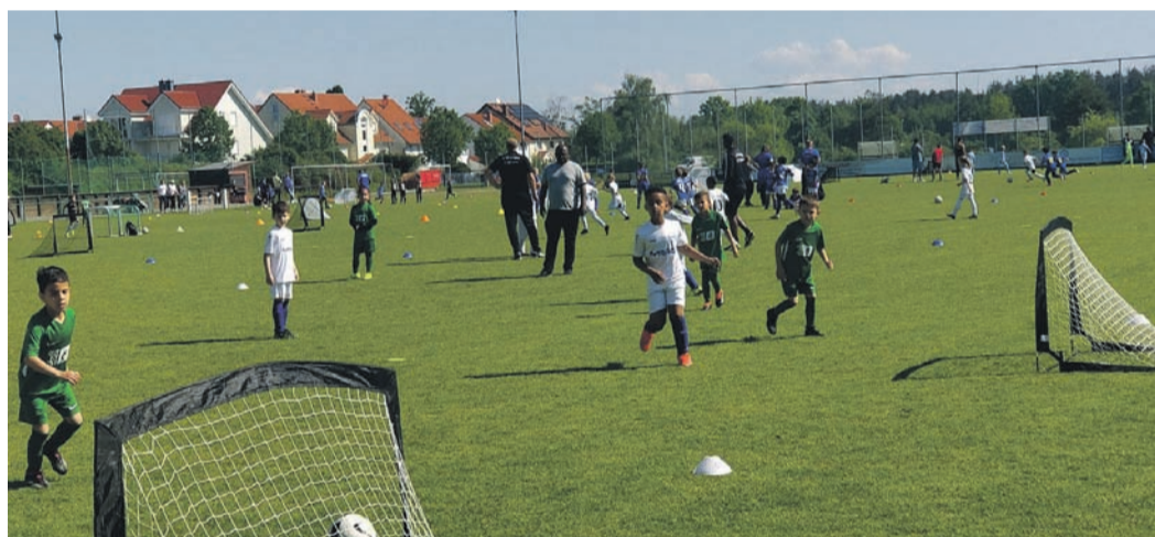
Vier Tore und Vier gegen Vier: Erstmals wurde bei der TS-Fußballwoche im G-Juniorenbereich nach den neuen Regeln im Kinderfußball gespielt.

Ober-Roden (NHR) Die 40. Jugend-Fußballwoche der Turnerschaft Ober-Roden fand am vergangenen Sonntag mit zwei E-Jugendturnieren eine stimmungsvollen Abschluss.