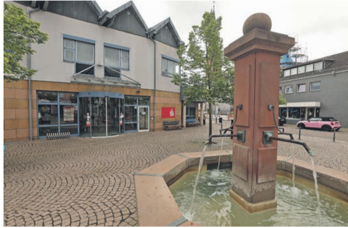
Die Fusionspläne der Sparkasse Dieburg, hier die Zweigstelle am Ober-Röder Marktplatz, mit der Sparkasse Darmstadt sorgen für Kritik in der Kommunalpolitik.

Bislang ist die Stadt, wie auch der Landkreis Darmstadt-Dieburg und alle Kommunen im Geschäftsgebiet, Mitglied des Sparkassenzweckverbandes Dieburg. Der gründete sich als Träger der Sparkasse Dieburg bereits 1973, also vier Jahre vor der Gebietsreform, in dessen Folge Rödermark vom Altkreis Dieburg in den Kreis Offenbach wechselte. Fast ein halbes Jahrhundert später forderte der beschlossene interfraktionelle Antrag nun, „im Bereich der Sparkassen für den ehemaligen Landkreis Dieburg eine Gebietsstruktur in Betracht zu ziehen, die die Ergebnisse der Gebietsreform widerspiegelt.“ Geprüft werden soll, ob ein kompletter Wechsel der Stadt Rödermark und ihrer Vermögensanteile zum Sparkassenzweckverband Langen-Seligenstadt möglich ist,