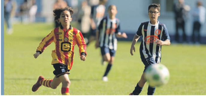
Die Gastgeber der JSG Rödermark (blau-weiß) in ihrem Vorrundenspiel gegen KV Mechelen. Die Belgier gewannen mit 4:0.