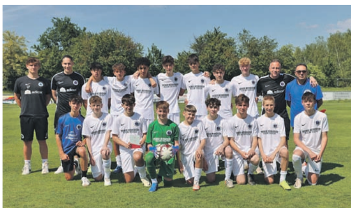
C-Junioren, Meister der Kreisliga Dieburg 2023/24.