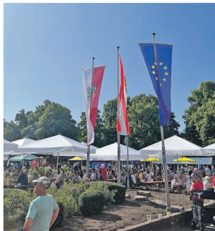
Sie feiern gemeinsam Europa. Mit vielen weiteren Helferinnen und Helfern sowie Akteuren und Akteurinnen findet am Sonntag, 26. Mai, ab 11 Uhr wieder das Europafest in Obertshausen statt. Das Fest steht unter der Regie von Kreis Offenbach und Stadt.

Weitere Informationen gibt es beim Kreis Offenbach unter Telefon: 06074 81801063 und der Stadt Obertshausen unter Telefon: 06104 7034111.