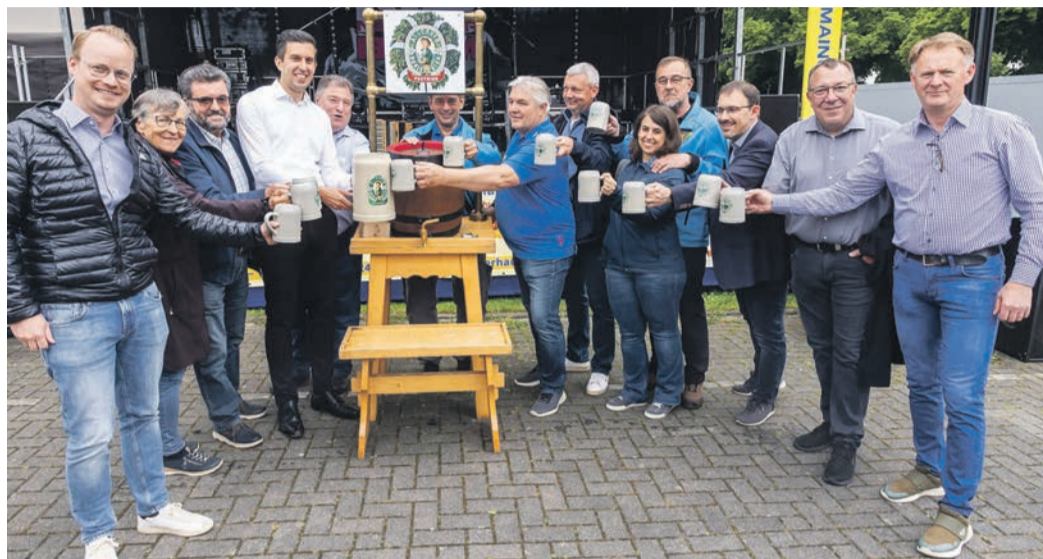
Bieranstich am Freitag.

Den Bieranstich bewältigte er dann kurzerhand mit zwei