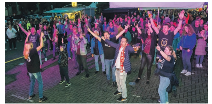
Beste Stimmung beim Publikum am Samstagabend bei den Quietschboys.

Bieranstich fing es an zu regnen und die „Neuberger Buam“ hatten sich sicher mehr Zuhörer für ihre Musik gewünscht. Am Samstag sah es bei den „Quietschboys“ schon anders aus. Mit bekannten Rock- und Hardrock-Hits, mit eigenen lustigen Texten in hessischer Mundart, hatten sie zahlreiche Gäste angelockt und brachten sie schnell in Bewegung. Es dauerte nicht lange, da wurde vor der Bühne kräftig getanzt. Ohne Zugaben durften die Musiker dann auch nicht von der Bühne. Auch die „Foolhouse Bluesband“, die