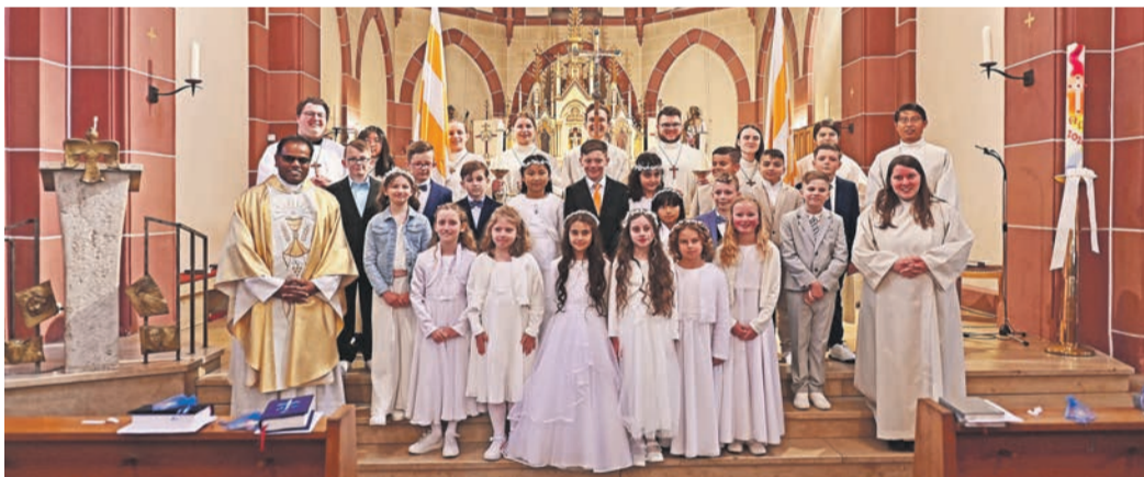
Kommunionkinder aus Jügesheim 2. Gruppe.

Beratung und Auskünfte: Telefon 061 06/2 6997-0