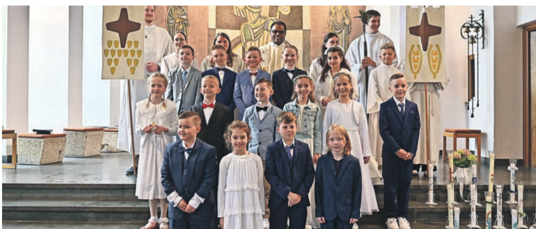
Kommunionkinder aus Dudenhofen.