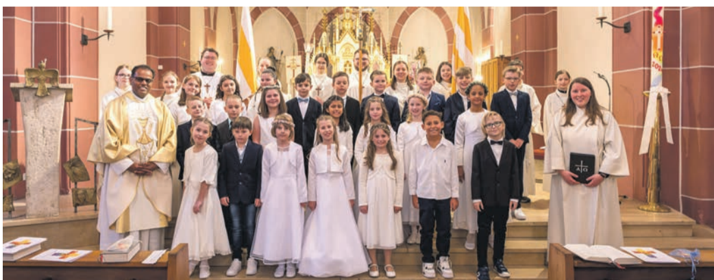
Kommunionkinder aus Jügesheim 1. Gruppe.