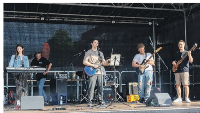
Mehrere Bands spielten, so auch die Musikschulband „Zugriff“.

Bläsern der „Groove Factory“, die Veranstaltung immer gut mit der Musik von „2SoTy- besucht, ganz besonders natürlich, wenn sich doch mal die des wechselhaften Wetters war Sonne zeigte.