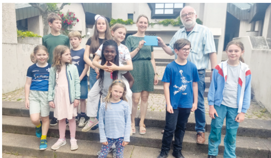
Kranichsteiner MinistrantInnen bei der Spendenübergabe.