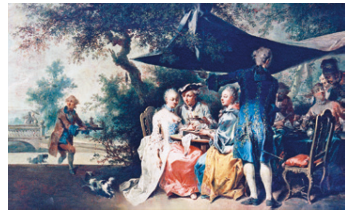
(Foto: Seekatz-Picknick © Hessische Hausstiftung, Schlossmuseum Darmstadt)

Geführter Spaziergang vom Residenzschloss in den Prinz-Georg-Garten