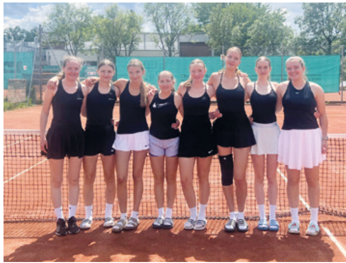
V.l.: SGA Juniorinnen I & II Mannschaft.