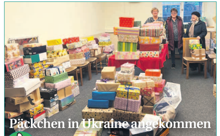
Päckchen in Ukraine angekommen