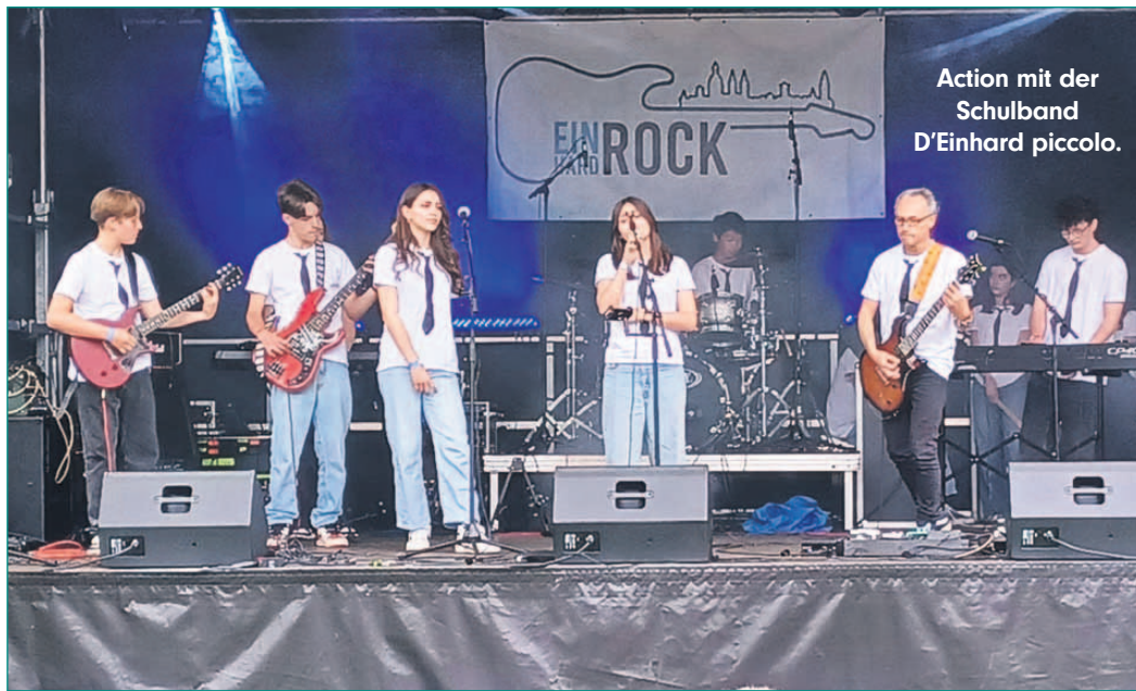
Action mit der Schulband D'Einhard piccolo.

ter Schulbands D'Einhard und D'Einhard piccolo sowie der Live-Band „Empty Hourglass“ aus dem Spessart, „Godskin“ aus Seligenstadt, „Beyond Confidence“ aus Stuttgart und „Secondary Virtues“. Diese Seligenstädter Band hatte das Rockfestival im Jahr 2022 ins Leben gerufen, um jungen Nachwuchsgruppen eine Auf-