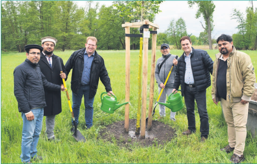
Ahmadiyya-Gemeinde spendet weiteren Baum für Seligenstadt: