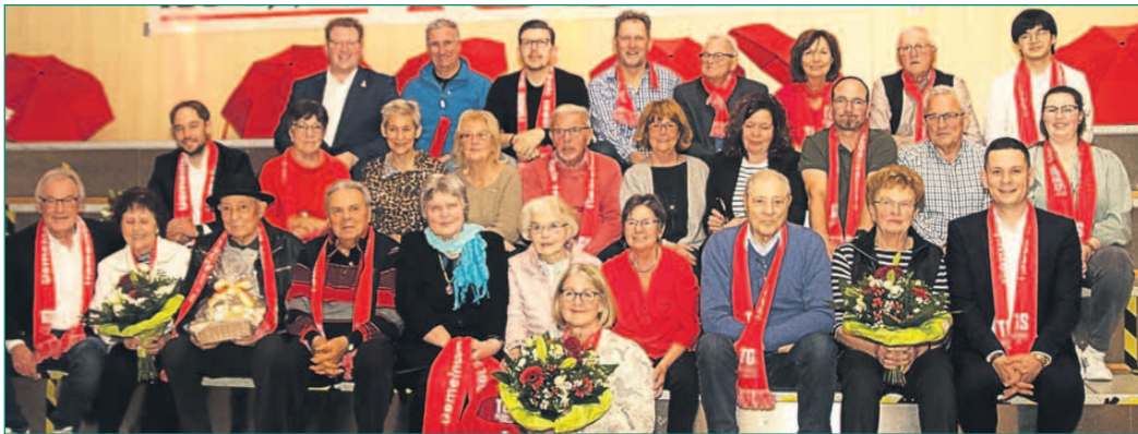
Zahlreiche Jubilare und Geehrte wurden vom TGS-Vorstand gewürdigt.