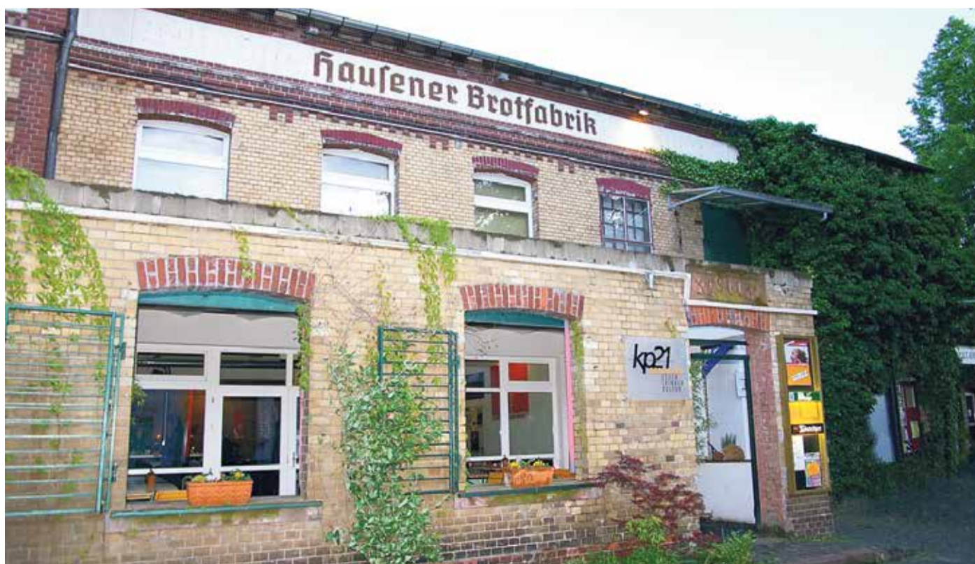
Brotfabrik in Frankfurt-Hausen