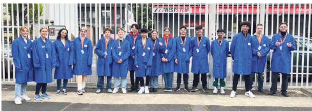
14 Jugendliche der Schule am Ried erkunden das Luftfahrttechnikunternehmen Nord-Micro.

Nord-Micro, ein weltweit führendes Unternehmen im Bereich Kabinendruck- und Belüftungssysteme für große Verkehrsflugzeuge, beschäftigt über 500 Mitarbeiter, von denen etwa 80 in Frankfurt im Bereich Entwicklung tätig sind. Das Unternehmen, das 1964 als Reparaturstandort für Starfighter-Jets der Luftwaffe gegründet wurde, konzentriert sich heute fast ausschließlich auf die zivile Luftfahrt und arbeitet mit allen großen Flugzeugherstellern sowie über 500 Airlines weltweit zusammen.