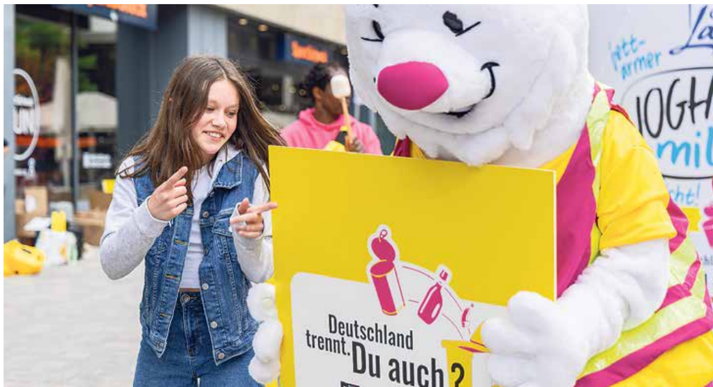
Bei der Aktion „Deutschland trennt. Du auch?“ zeigt auch der fröhliche Trenn-Bär, wie richtige Abfalltrennung funktioniert.

(PM) | „Deutschland trennt. Du auch?“ Unter der Schirmherrschaft von Bundesumweltministerin Steffi Lemke startet am 3. Juni Deutschlands bisher größte Partneraktion zur Aufklärung über richtige Abfalltrennung. Bis zum 16. Juni engagieren sich bundesweit mehr als 200 Kommunen erstmals gemeinsam mit den dualen Systemen und großen Partnern aus dem Lebensmitteleinzelhandel sowie mit Vertretern der Entsorgungswirtschaft für ein Ziel: so viele Menschen wie möglich zu mehr und besserer Mülltrennung zu motivieren. Initiiert und organisiert wird die Aktion von „Mülltrennung wirkt“, einer Initiative der dualen Systeme. Im Mittelpunkt von „Deutschland trennt. Du auch?“ stehen unübersehbare XXL-Verpackungen an öffentlichen Plätzen. Sie sollen die Menschen auf die Aktion aufmerksam machen.