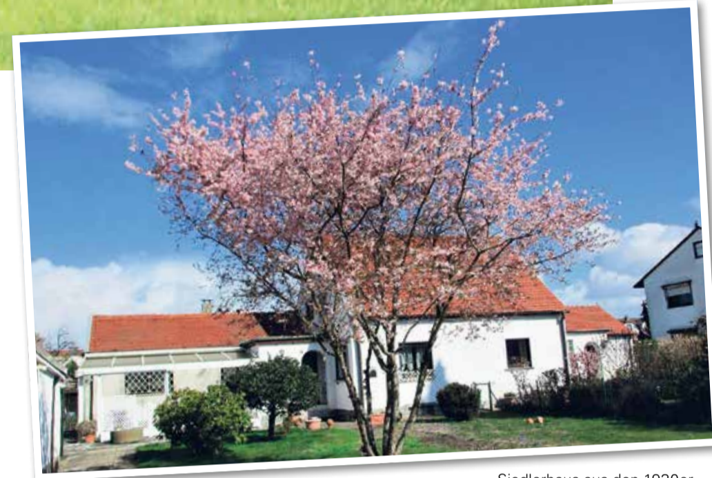
Siedlerhaus aus den 1930er-Jahren, Willi-Brundert-Siedlung

Brötchen liebevoll geformt wurden. Heute erinnert nur noch das alte Fabrikschild an diese Zeit. Die 1.500 Quadratmeter große Fläche beherbergt nun einen einzigartigen Kulturraum. In dem charmanten Industriegebäude finden jährlich rund 60 Konzerte, 100 Clubnächte sowie Lesungen, Diskussionen, Vorträge und Filmvorführungen im großen Saal statt. Hier entsteht eine kulturelle Vielfalt ohne kommerzielle Absichten. Künstlerische Qualität, anregende Diskussionen und lebhaft Dialoge stehen im Mittelpunkt. Die Brotfabrik bietet auch anderen Kulturen eine Bühne und setzt sich für internationale Gesinnung, Toleranz, Verständnis und ein friedliches Miteinander ein. Der gemeinnützige Verein Kulturprojekt 21 e.V. organisiert Konzerte, Lesungen, Clubnächte und mehr im großen Saal der Brotfabrik. Dabei liegt der Fokus auf internationaler Musik, aber auch deutsche und lokale Künstler sind im Programm vertreten. Bei den Clubnächten wird zu verschiedenen Musikstilen wie Salsa, Worldbeat, Tango, Partyklassikern sowie Soul und Funk getanzt.