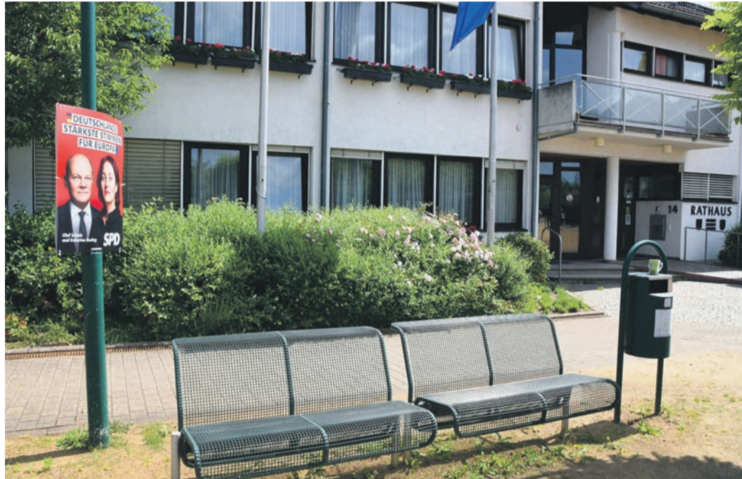
Stein des Anstoßes: Als Eppertshäuser SPD-Vertreter dieses Europa-Wahlplakat mit Olaf Scholz und Katarina Barley vor dem Rathaus an einer Bank auf dem Franz-Gruber-Platz anbrachten, erneteten sie aus einer Gruppe, die sich montags dort trifft, den Spruch: „Hängt ihn auf, den Scholz!“ An anderer Stelle im Ort wurden SPD- (und Grünen-)Plakate zerstört.

Eppertshausen (EA) (jedö) Den Europa-Wahlkampf haben die Eppertshäuser Gemeindevertreter aller Couleur in den vergangenen Monaten stets draußen gelassen, wenn sie sich im kleinen Saal der Bürgerhalle versammelten. In der jüngsten Sitzung - der letzten vor der Wahl am 9. Juni - kam er dann doch zur Sprache: Weil zwei seiner Fraktionskollegen ein unerfreuliches Erlebnis auf dem Franz-Gruber-Platz hatten und Plakate seiner Partei an anderer Stelle im Ort zerstört wurden, gab SPD-Fraktionschef Günter Schmitt eine persönliche Erklärung ab. „Auch in Eppertshausen sind wir nicht mehr auf einer Insel der Glückseligen“, stellte er fest. Was war passiert?