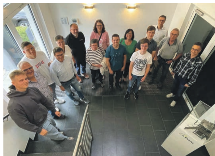
Firmenbesichtigung in Ringheim.

Fahrradtour und Adventure-Golf am 8. Juni: Man trifft sich um 14 Uhr am Kolpingheim und fährt mit dem Fahrrad zum Adventure-Golf nach Groß-Zimmern. Preis: Kinder bis 15 Jahren sind frei. Für junge Erwachsene bis 25 Jahren beträgt der Preis 5 Euro und Erwachsene 8 Euro. Anfahrt mit dem Auto ist auch möglich. Großer Parkplatz ist vorhanden. Auf der Rückfahrt gibt es die Möglichkeit einer