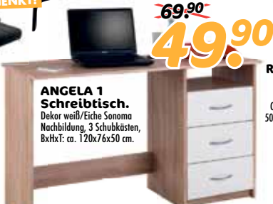
ANGELA 1 Schreibtisch. Dekor weiß/Eiche Sonoma Nachbildung, 3 Schubkästen, BxHxT: ca. 120x76x50 cm.