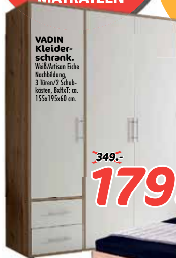
VADIN Kleiderschrank. Weiß/Arisan Eiche Nachbildung, 3 Türen/2 Schubkästen, BxHxT: ca. 155x195x60 cm.