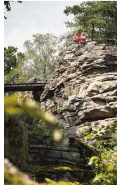
Die teils bizarr geformten Granitfelsen – wie hier der Hackelstein – ragen steil in die Höhe.

torischer Lehrpfad“ erreichbar. Der Weg führt auch am Saubadfelsen und am Waldhaus vorbei. Der Zipfeltannenfelsen ist zudem ein offizieller Picknickplatz: Unter www.steinwald-urlaub.de kann man einen Picknickkorb vorbestellen und bekommt diesen gefüllt mit regionalen Leckereien direkt zum Felsen geliefert. Wer das Felsenparadies im Naturpark Steinwald lieber per Rad erkunden möchte, kann das beispielsweise entlang der „Sagenhaften Steinroute“ tun. Der Rundradweg eignet sich für Tourenräder und Gravelbikes. Sehr geübte Mountainbiker kommen dagegen auf der „Steinwald Trailrunde“ auf ihre Kosten - vorbei am Zipfeltannenfelsen, Vogelfelsen und Räuberfelsen (hinter dem übrigens einst Wegelagerer ihr Unwesen getrieben haben sollen). Der Steinwald ist zudem bei Kletterfans beliebt, da der Granit in der Szene als besonders eigenwillig gilt. 20 Routen gibt es in der Region, von den Schwierigkeitsgraden 1 bis 8+.