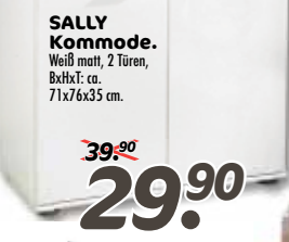
SALLY Kommode. Weiß matt, 2 Türen, BxHxT: ca. 71x76x35 cm.