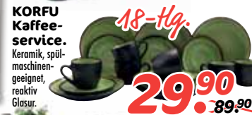
KORFU Kaffeeservice. Keramik, spülmaschinengeeignet, reaktiv Glasur.