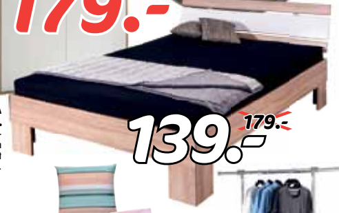
JANNA Futonbettgestell. Eiche Sonoma Nachbildung, Absatzfarbe weiss glänzend, ca. 140x200 cm Liegefläche. Ohne Matratze, Lattenrost und Deko.