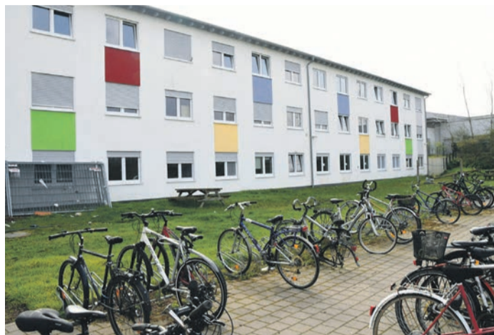
Viele Fahrräder sieht man an der Asylbewerber-Unterkunft in der Münsterer Goebelstraße. Dennoch verlangt die neue Stellplatz-Satzung vor derlei Heimen mehr Pkw- als Fahrrad-Stellplätze.

Münster (jedö) Gleich zweimal fassten die Münsterer Gemeindevertreter in diesem Frühjahr den Beschluss, die Stellplatz-Satzung der Kommune in mehreren Punkten zu ändern. Inhaltlich war nach der März-Sitzung alles gesagt, doch formal mussten CDU, FDP, SPD und ALMA-Die Grünen ihr Votum in der Mai-Sitzung erneut angeben. Der Grund dafür war die Stellungnahme der Kommunalaufsicht des Landkreises, dass die Änderungssatzung zunächst Fehler wie die Verwendung des Begriffs „Nutzfläche“ statt der korrekten Bezeichnung „Nutzungsfläche“ beinhaltete und weitere redaktionelle Anpassungen erforderte. Substanzieller - und trotz des letztlich einstimmigen Ergebnisses auch umstrittener - waren indes die inhaltlichen Festlegungen. Geändert oder neu in die Münsterer Stellplatz-Satzung eingearbeitet wurden Regelungen zu Mehrfamilienhäusern