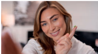
Bekommt man einen Splitter nicht richtig heraus, kann sich ein Eiterherd bilden.