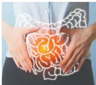
Wiederkehrende Darmbeschwerden wie Durchfall, Bauchschmerzen und Blähungen können die Lebensqualität Betroffener stark einschränken.

Mit der Zeit entwickelte sich für diese unerklärlichen Beschwerden das Bild des „gereizten Darms“, später formte sich der Begriff des Reizdarmsyndroms.