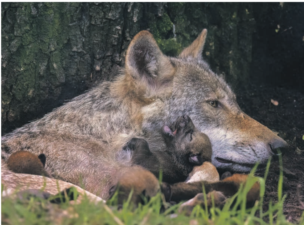
Das Team des Wildparks freut sich auf zahlreiche Besucher, die sich an dem unerwarteten Nachwuchs erfreuen.