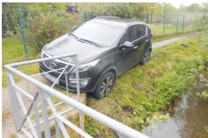
Ein Auto auf Abwegen. Gesichtet in Arheilgen.