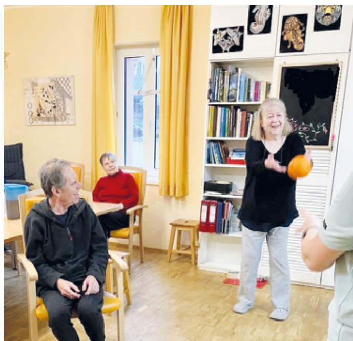
Die gemütliche Wohnküche der WG wird bei Bedarf zur Sporthalle umfunktioniert.

da jede Führung durch das Haus für Irritationen bei den Mieterinnen und Mietern sorgt und einen Eingriff in die Privatsphäre darstellt. Daher bieten wir nur zu besonderen