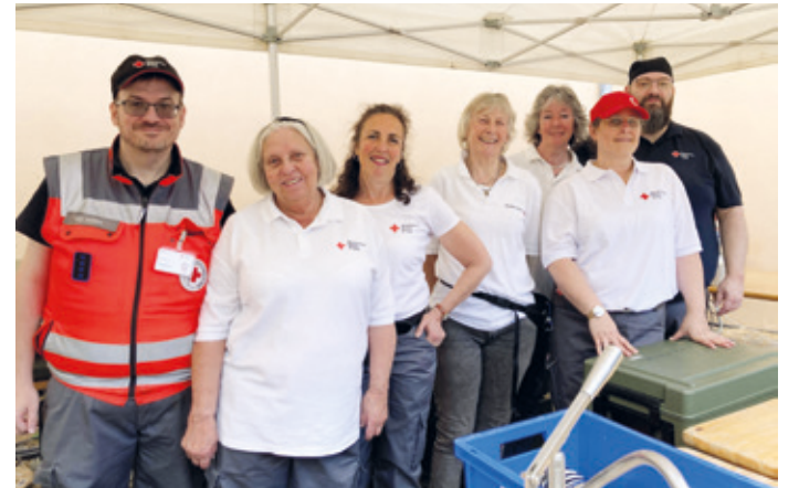
Das Team Verpflegung des DRK OV Arheilgen-Wixhausen bei den Vorbereitungen im Außenbereich des Jagdschloss Kranichstein.

aus europäischen Partnerstädten und Partnervereinen in den Dialog zu kommen. Bei herrlichem Mai-Wetter wurde das ganze Wochenende gewandert, gegessen und getrunken, begleitet von heiterer Jazz Musik und erfri-