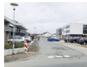
Kiefernweg 2019 und 2024.