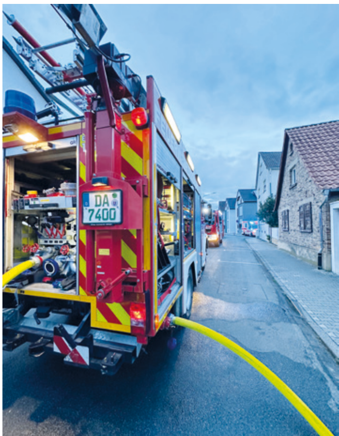
Einsatzfahrzeuge beim Küchenbrand in der Hauptstraße.

Die Leitstelle alarmierte die Freiwillige Feuerwehr Erzhausen am Morgen, den 27. Mai, um 04.22 Uhr zu einem gemeldeten Küchenbrand in die Hauptstraße. Bei Eintreffen der ersten Kräfte bestätigte sich die Lage und die Küche im ersten Obergeschoss brannte. Die Bewohner wurden glücklicherweise im Schlaf durch Rauchwarnmel-