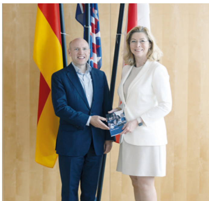
Im Hessischen Landtag zum Gespräch über die Europawahlen mit dem Hessischen Europaminister Manfred Penz.

Liebe Erzhäuserinnen, liebe Erzhäuser, das Europäische Parlament ist das einzige direkt gewählte Gremium in der Europäischen Union. Es vertritt die Interessen aller Bürgerinnen und Bürger in der Union. Auf europäischer Ebene werden viele Entscheidungen getroffen, die die Bürgerinnen und Bürger direkt betreffen. Gehen Sie am 9. Juni 2024 ins Bürgerhaus zur Wahl und bestimmen Sie mit, wer künftig in Europa die Themen setzt und darüber entscheidet.