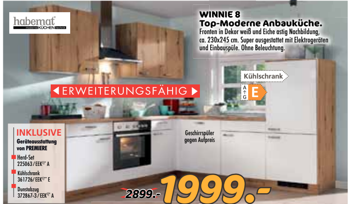
WINNIE 8 Top-Moderne Anbauküche. Fronten in Dekor weiß und Eiche astig Nachbildung, ca. 230x245 cm. Super ausgestattet mit Elektrogeräten und Einbauspüle. Ohne Beleuchtung.

GROSSE FARB- AUSWAHL ZUM INDIVIDUELLEN PREIS