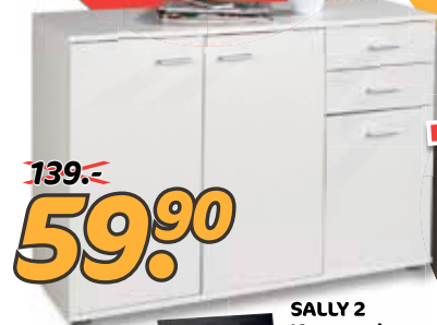
SALLY 2 Kommode. Weiß matt, 3 Türen/2 Schubkästen, BxHxT: ca. 106x76x35 cm.

+6,5% ZUSÄTZLICH BEST DEALS-RABATT AUF ALLES