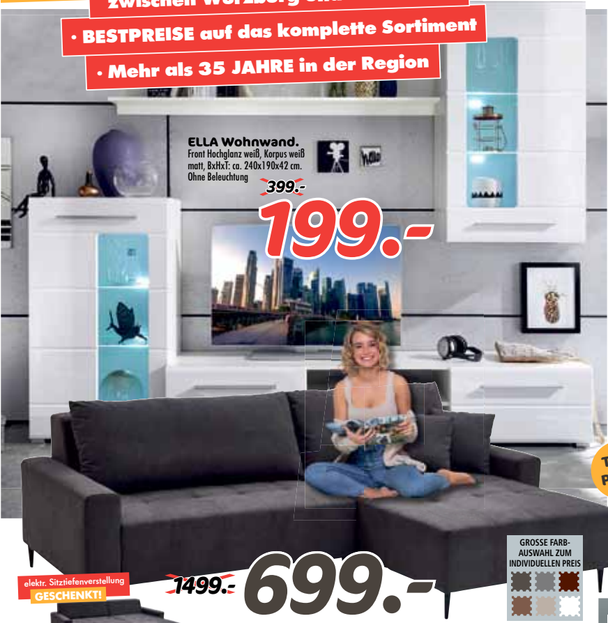
ELLA Wohnwand. Fronti Hochglanz weiß, Korpus weiß matt, BxHxT: ca. 240x190x42 cm. Ohne Beleuchtung