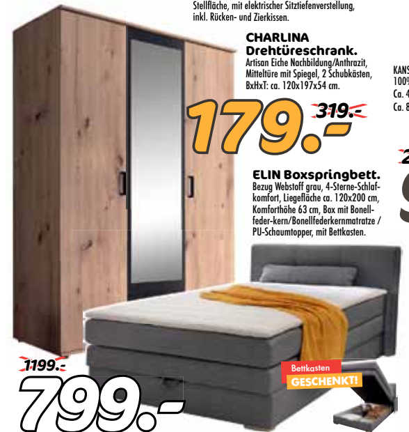
CHARLINA Drehtüreschrank. Artisan Eiche Nachbildung/Anthrazit, Mitteltüre mit Spiegel, 2 Schubkästen, BxHxT: ca. 120x197x54 cm.

FASHION Kombiservice. Spülmaschinen- und mikrowellengeeignet, Steinzeug.