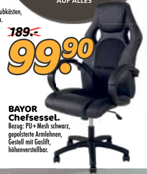
BAYOR Chefessel. Bezug: PU+Mesh schwarz, gepolsterte Armlehnen, Gestell mit Gaslift, höhenverstellbar.