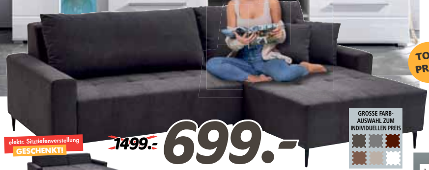
CHRISTEL Polstergarnitur. Ottomane rechts, Bezug Microfaser dunkelgrau, ca. 255x180 cm Stellfläche, mit elektrischer Sitztiefenverstellung, inkl. Rücken- und Zierkissen.

GROSSE FARB- AUSWAHL ZUM INDIVIDUELLEN PREIS