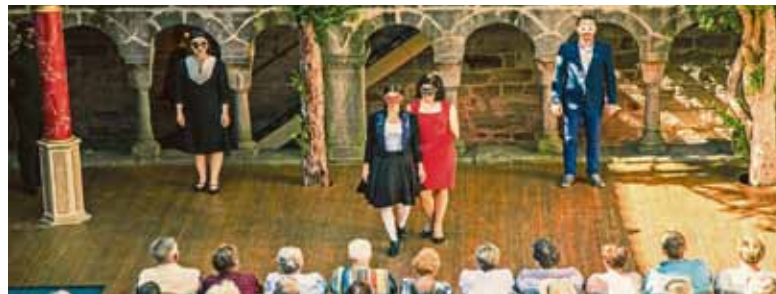
Das Publikum sitzt ganz nah an der Theaterbühne, hier bei „Romeo und Julia“ 2016.

Die sommerlichen Festspiele im ehemaligen Benediktinerkloster zählen zu den ältesten Freilichttheatern in Deutschland, seit 1949 locken sie jedes Jahr zigtausende Zuschauer von nah und fern nach Feuchtwangen. Die fränkische Fachwerkstadt liegt südwestlich von Nürnberg an der Romantischen Straße, einer der beliebtesten deutschen Ferienstraßen. Auf dem Festspielprogramm stehen auch in diesem Jahr sechs große Inszenierungen, sowohl klassische Dramen und Komödien als auch moderne Stücke und Kindertheater.