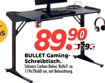
BULLET Gaming-Schreibtisch. Schwarz Carbon Dekor, BxHxT: ca. 119x78x60 cm, mit Beleuchtung.