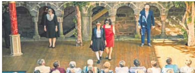
Das Publikum sitzt ganz nah an der Theaterbühne, hier bei „Romeo und Julia“ 2016.

Die sommerlichen Festspiele im ehemaligen Benediktinerkloster zählen zu den ältesten Freilichttheatern in Deutschland, seit 1949 locken sie jedes Jahr zigtausende Zuschauer von nah und fern nach Feuchtwangen. Die fränkische Fachwerkstadt liegt südwestlich von Nürnberg an der Romantischen Straße, einer der beliebtesten deutschen Ferienstraßen. Auf dem Festspielprogramm stehen auch in diesem Jahr sechs große Inszenierungen, sowohl klassische Dramen und Komödien als auch moderne Stücke und Kindertheater.