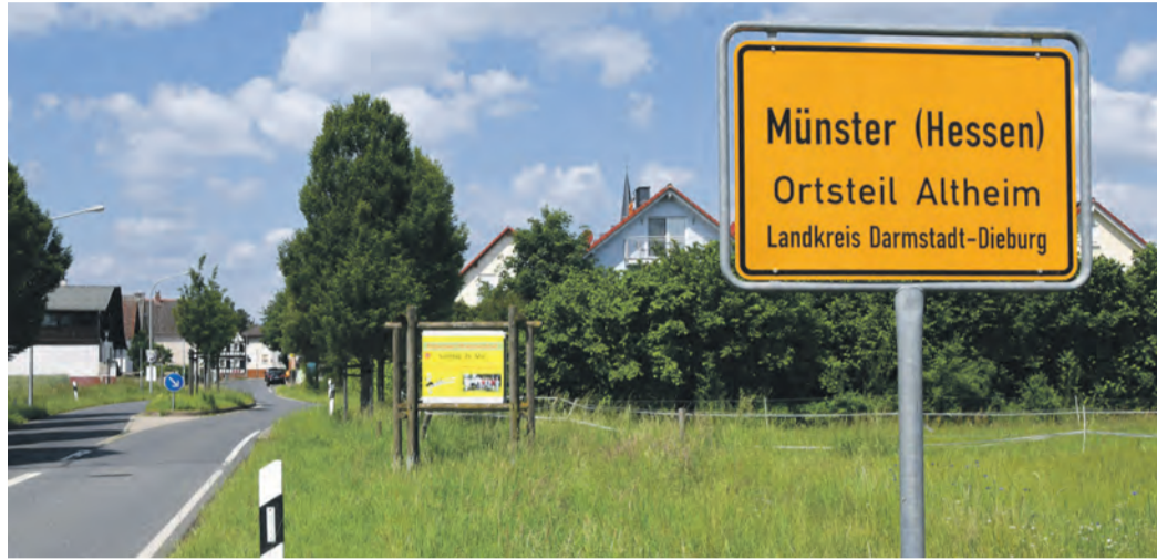
Altheim bleibt ohne eigenen Ortsbeirat: Ein entsprechender CDU-Antrag fiel in der Münsterer Gemeindevertretung hauchdünn durch. Das Foto zeigt den südlichen Ortseingang. Neben dem Ortsschild links lugt der Turm der Evangelischen Kirche hervor.

Altheim (jedö) Immer wieder äußern Altheimer, dass sie sich mit den Belangen ihres Ortsteils von der Münsterer Gemeindeverwaltung und der Kommunalpolitik nicht in dem Maße gesehen fühlen wie die „Kern-Münsterer“. Immer wieder entbrennen Debatten beispielsweise über die Ungleichbehandlung der beiden Freizeitzentren und langwierige Schandflecken in Altheim. Vor diesem Hintergrund kam es überraschend, dass in der Mai-Sitzung der Münsterer Gemeindevertretung ein CDU-Antrag mit 15:16 Stimmen denkbar knapp durchfiel, in Altheim einen Ortsbeirat einzuführen. Den dürfen die Bürger des Ortsteils nun zumindest bei der nächsten Hessischen Kommunalwahl 2026