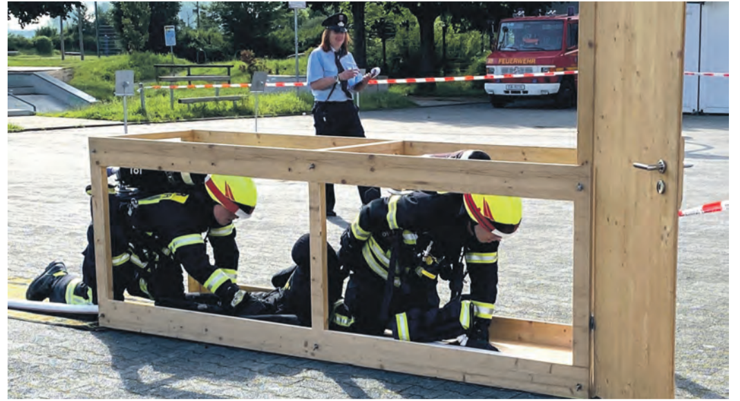
Die Wertungsrichter schauen bei der Leistungsübung ganz genau hin, dass die Dienstvorschrift, die unter anderem Unfälle verhüten soll, genau eingehalten wird.