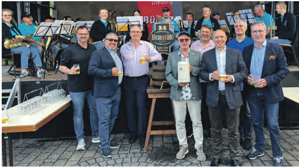
Gleich mehrere Politiker halfen mit, das Schlachtfest beim Fassanstich zu eröffnen. Die Gastgeber versprachen sich, neben der Publicity, vor allem eine finanzielle Unterstützung.