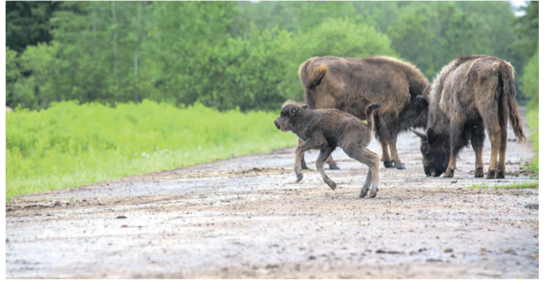
Zwei Kälbchen wurden in den letzten Tagen im Wisentwald Muna Münster geboren.

ein weiteres Wisent-Baby auf die Welt. Namen haben die beiden jüngsten Mitglieder der Herde übrigens noch nicht. Die Herde steht im Wandel der Zeit. Nachdem die drei ältesten Tiere der Herde inzwischen verstorben sind und auch der erste Jungbulle aus Inzuchtgründen der Herde entnommen werden musste, leben nun inzwischen