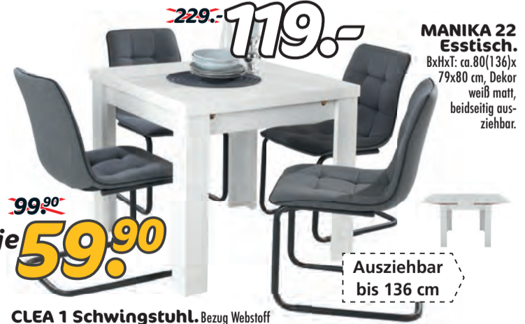
CLEA 1 Schwingstuhl. Bezug Webstoff dunkelgrau, mit Keder schwarz, Gestell Rundrohr schwarz matt.