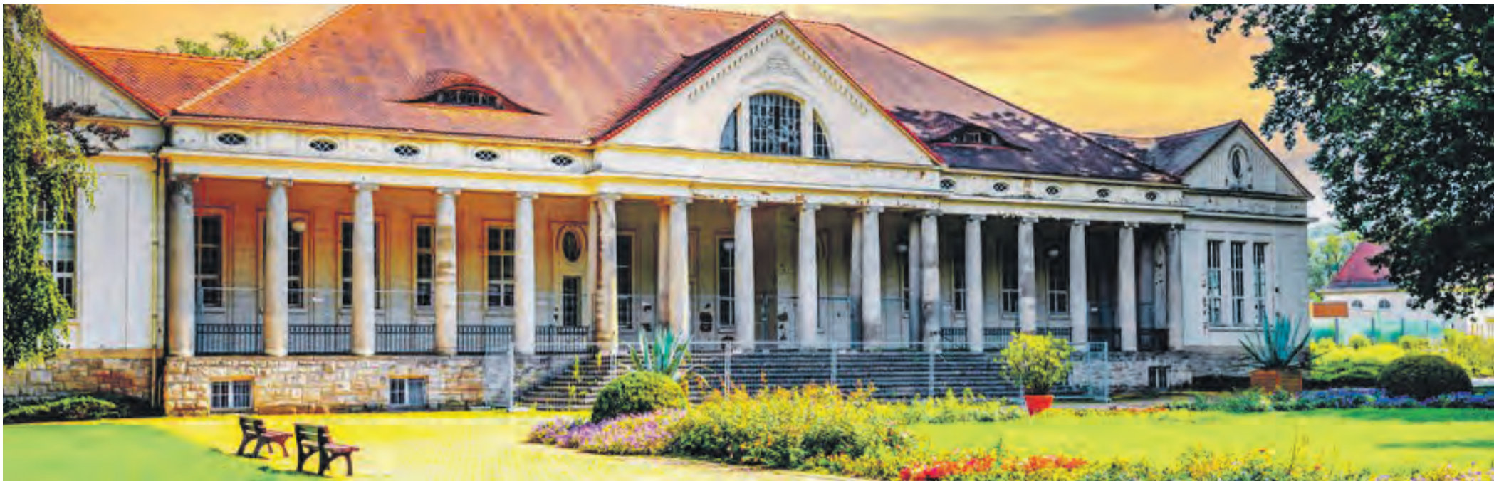
Das „Alte Kurhaus“ in Bad Kösen wurde 1911 mit neoklassizistischer Fassade errichtet, heute ist es ein sogenannter „Lost Place“. Von Juni bis September findet hier die Ausstellung „Wir legten Hände in das Wasser“ statt.