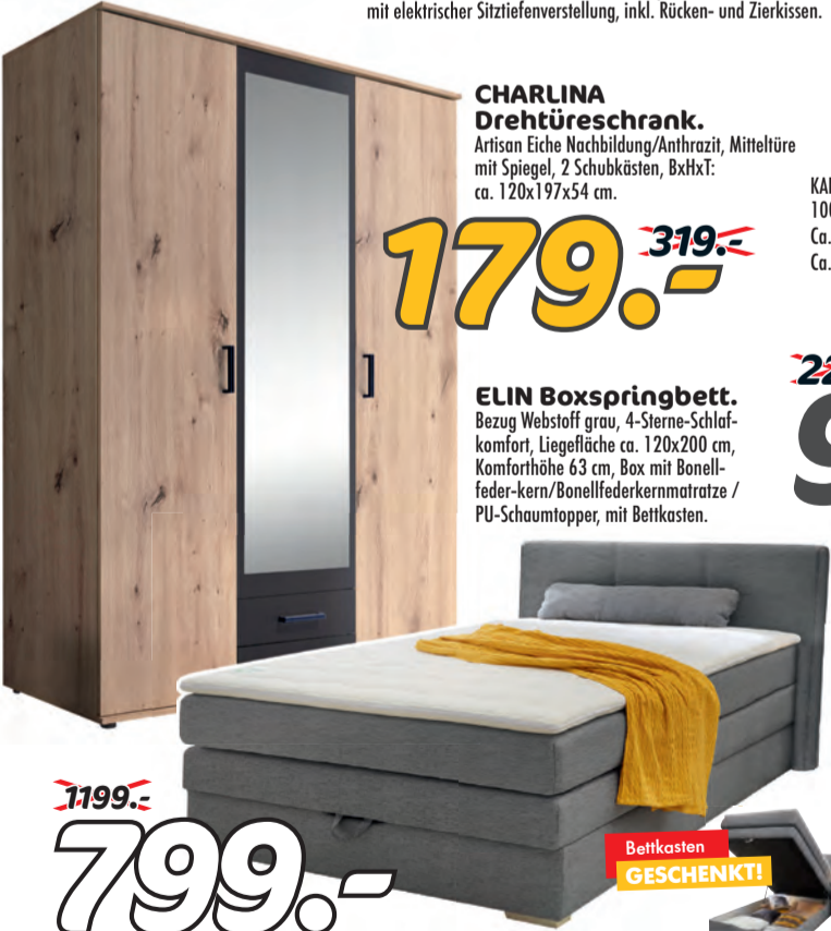
CHARLINA Drehtüreschrank. Artisan Eiche Nachbildung/Anthrazit, Mitteltüre mit Spiegel, 2 Schubkästen, BxHxT: ca. 120x197x54 cm.

GROSSE FARBAUSWAHL ZUM INDIVIDUELLEN PREIS