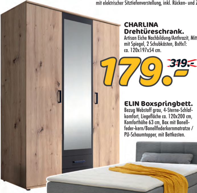
CHARLINA Drehtüreschrank. Artisan Eiche Nachbildung/Anthrazit, Mitteltüre mit Spiegel, 2 Schubkästen, BxHxT: ca. 120x197x54 cm.

GROSSE FARBAUSWAHL ZUM INDIVIDUELLEN PREIS