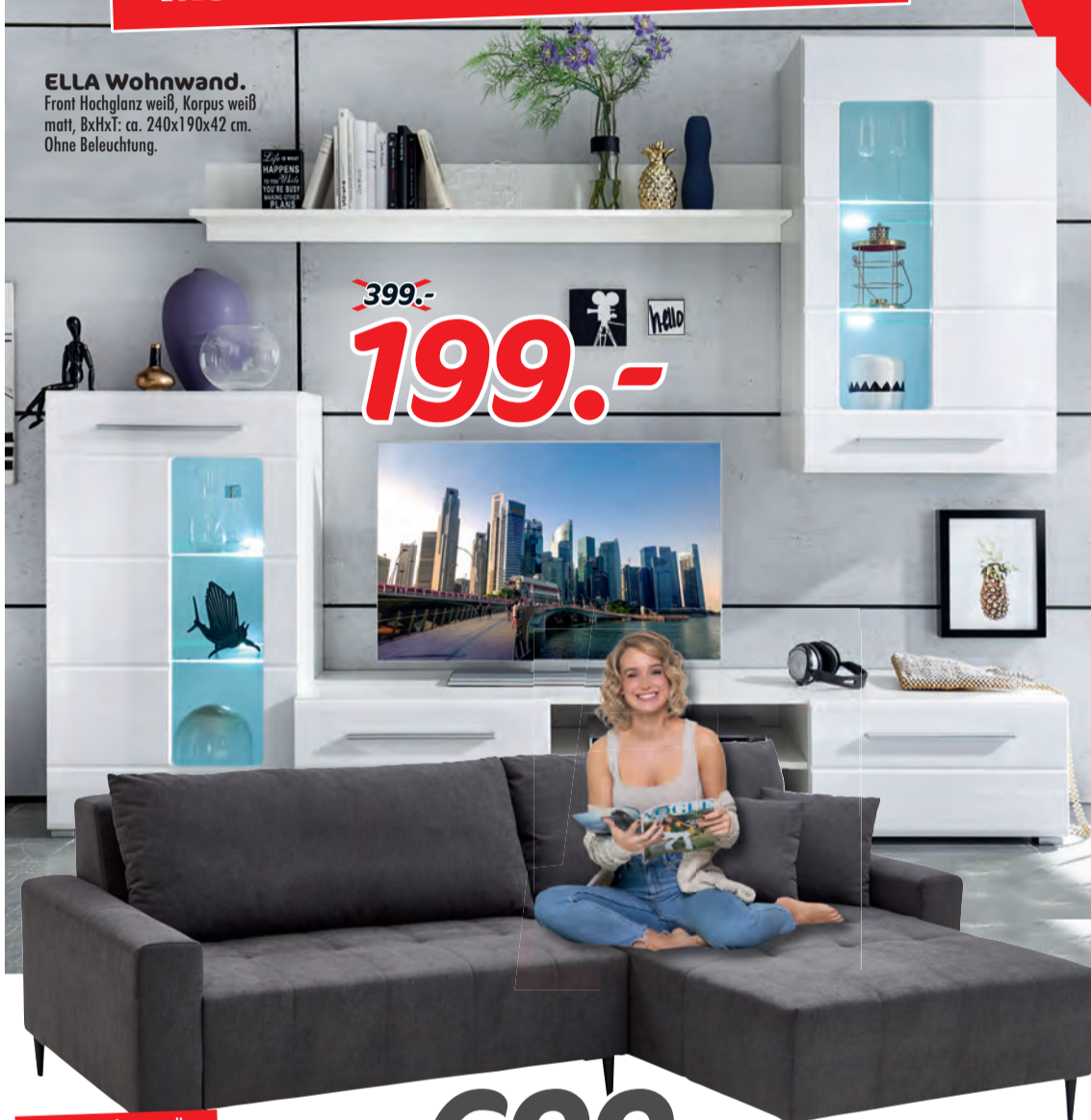
ELLA Wohnwand. Front Hochglanz weiß, Korpus weiß matt, BxHxT: ca. 240x190x42 cm. Ohne Beleuchtung.

+6,5% ZUSÄTZLICH BEST DEALS-RABATT AUF ALLES