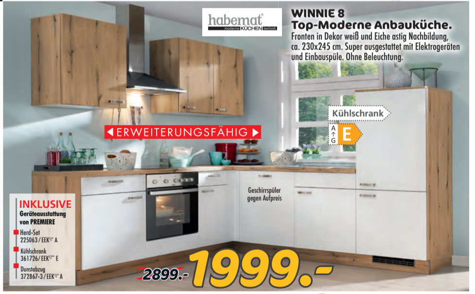
WINNIE 8 Top-Moderne Anbauküche. Fronten in Dekor weiß und Eiche astig Nachbildung, ca. 230x245 cm. Super ausgestattet mit Elektrogeräten und Einbauspüle. Ohne Beleuchtung.

INKLUSIVE Geräteausstattung von PREMIERE Herd-Set 225063 / EEK** A Kühlschrank 361726 / EEK** E Dunstabzug 372867-3 / EEK** A