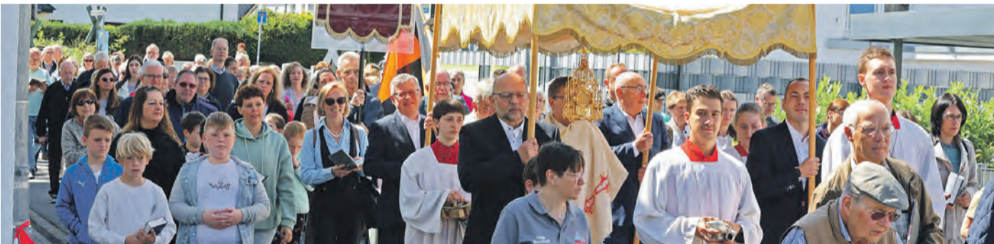
Die Teilnehmer der Prozession vom Kulturhallenvorplatz zur Kirche wurden glücklicherweise vom Regen verschont. Schauer gab es dann erst am Nachmittag.

An Fronleichnam wurde rund um die St. Nazarius-Kirche gefeiert