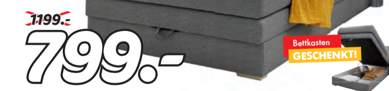
ELIN Boxspringbett. Bezug Webstoff grau, 4-Sterne-Schlaf- komfort, Liegefläche ca. 120x200 cm, Komforthöhe 63 cm, Box mit Bonell- feder-kern/Bonellfederkernmatratze / PU-Schaumtopper, mit Bettkasten.

19.99 ab 12.99 KANSAS Kopfkissen. 100% PES, Bezug: 100% PES, Markenhohlfaser, kochfest. Ca. 40x80 cm, Füllung: 370 g 19.99 12.99 Ca. 80x80 cm, Füllung: 800 g 29.99 19.99