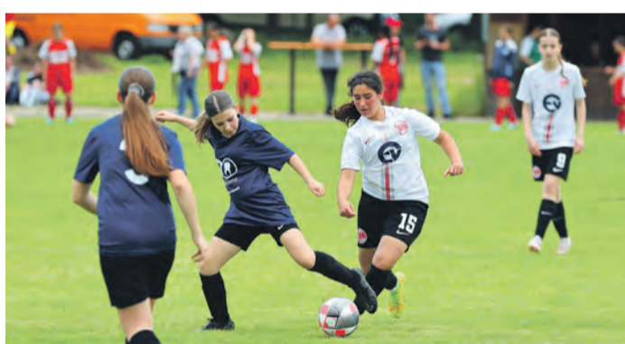
Die MSG Dietzenbach/Ober-Roden (dunkle Trikots), hier im Spiel gegen Kickers Offenbach, belegte beim eigenen Turnier den siebten Platz.