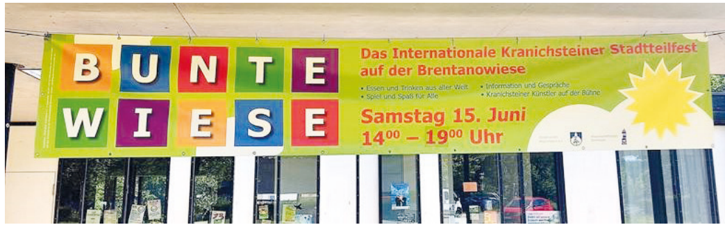
Bunte Wiese 2024.