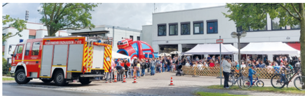
Großer Andrang beim diesjährigen Erzhäuser Feuerwehrfest.

Erzhausen (kr). Letzte Woche hat der Förderverein der Freiwilligen Feuerwehr Erzhausen das diesjährige Feuerwehrfest zu Fronleichnam im Feuerwehrhaus in der Rodenseestraße veranstaltet. Los ging es Mittwochabend ab 19.00 Uhr. Die bewährte Mischung aus kühlen Getränken und heißem Grillgut hat zusammen mit dem Sound der Band „Sound 77“ viele Stunden für super Stimmung gesorgt. Die letzten Gäste machten sich erst weit nach Mitternacht auf den Heimweg. Doch den Helfern blieb nicht viel Zeit zum Ausruhen – am nächsten Morgen musste der Umbau vom Konzert zum Familienfest geleistet werden. Ab 11.00 Uhr trudelten dann am Donnerstagmorgen zahlreiche die Gäste ein. Für Kinder lud eine Hüpfburg zum Toben ein. Gleichzeitig gab es die Möglichkeit Fahrten mit dem Feuerwehrauto zu machen,