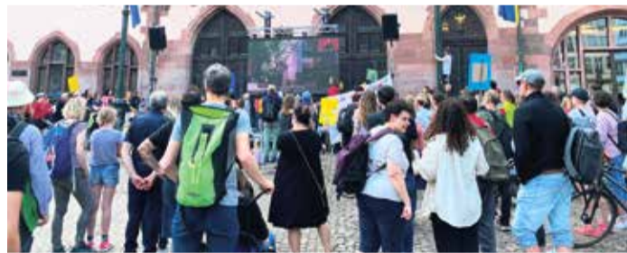
Vorführung des Musikvideos „Es ist Zeit!“ in Zusammenarbeit mit LMNZ.