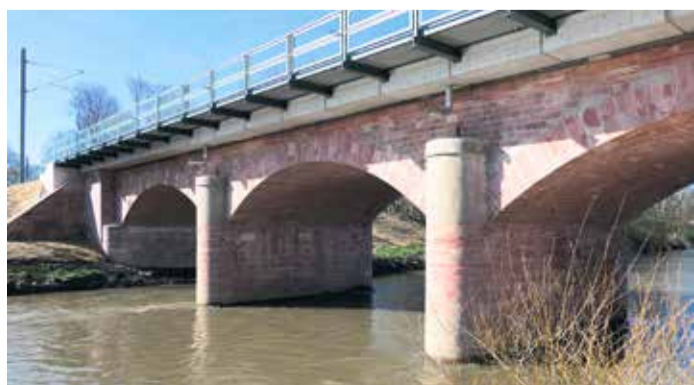
Eisenbahnbrücke Nied nach der denkmalgerechten Teilerneuerung.