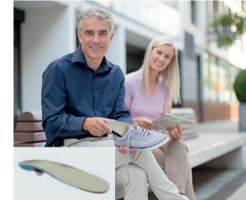
Orthopädische Einlagen helfen bei vielen Beschwerden wie Hallux rigidus – der Arthrose im großen Zeh. Die igli Control von medi entlastet die Zehe und kann die Schmerzen lindern. www.medi.de

ziell für die Therapie des Hallux rigidus entwickelt und empfiehlt sich ebenfalls bei Mittelfußschmerzen. Ihre korrigierenden und stützenden Elemente entlasten den schmerzhaften Bereich. Die