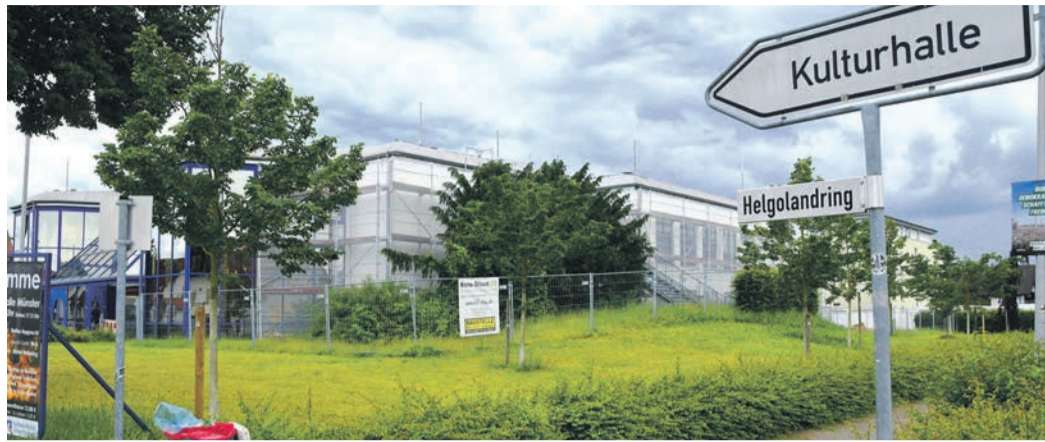
Die Fassadensanierung an der Münsterer Kulturhalle soll Ende Juni abgeschlossen sein.

Seit Februar läuft zudem die Fassadensanierung, bei der ebenfalls ein Ende in Aussicht ist: Bis Ende Juni soll sie durch sein. Zuletzt erhielten die Fenster den Anstrich. Nun erfolgt die Fassadenreinigung, wofür aufgrund des Alters des vorhandenen Anstrichs, der sichtbaren Schäden und des Salzgehalts im Mauerwerk durch Feuchtigkeit