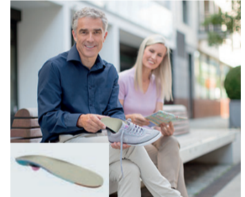
Orthopädische Einlagen helfen bei vielen Beschwerden wie Hallux rigidus – der Arthrose im großen Zeh. Die igli Control von medi entlastet die Zehe und kann die Schmerzen lindern. www.medi.de

ziell für die Therapie des Hallux rigidus entwickelt und empfiehlt sich ebenfalls bei Mittelfußschmerzen. Ihre korrigierenden und stützenden Elemente entlasten den schmerzhaften Bereich. Die