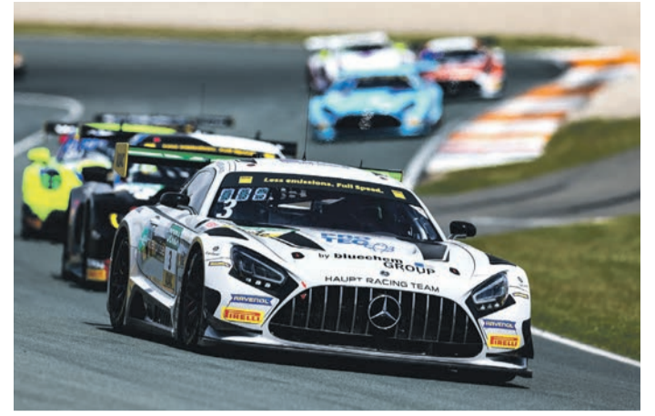
Gute Punkteausbeute festigt Rang 3 in der Gesamtwertung des ADAC GT Masters.