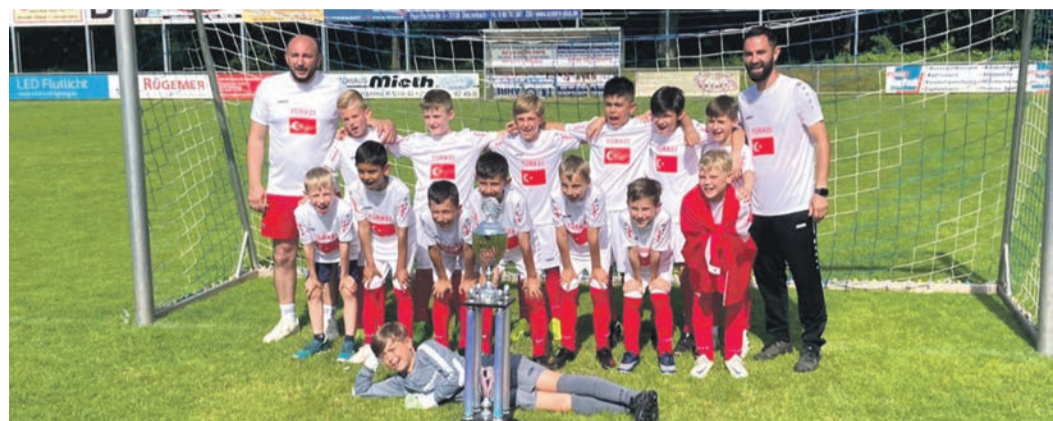
Der Nachwuchs der Gastgeber schlüpfte in die Rolle der Türkei und freute sich über Platz eins.

Weitere Ergebnisse: Die U17 unterlag beim VfB Unterliederbach mit 1:6, hat den Klassenerhalt aber geschafft. Die E1 besiegte den KSV Urberach mit 14:0 und setzte sich bei Viktoria Schaafheim mit 2:0 durch. Das reichte am Ende für den dritten Platz. Die E2 besiegte die JSG Kleestadt/Langstadt II mit 8:3. In einem Testspiel unterlag die D1 der U12 von Kickers Offenbach mit 2:5. Bei einem Vereinsturnier in Darmstadt besiegte die D1 die DJK-SSG Darmstadt III (1:0), RW Darmstadt II (2:0), die S.K.G Rodgau (1:0), den FC Alsbach II (4:0), die JSG Bexbach (1:0) und den SV Wiesenthalerhof Kaiserslautern (1:0). Nur gegen den SVV Mainz unterlag das Manega-Team mit 1:3. Es wird nun nochmal getestet, ehe der Ball komplett ruht. Folgende Testspiele stehen auf dem Plan: Samstag (15.): E2 - S.K.G Rodgau III (10.30 Uhr), FC Schwalbach II - E1 (12 Uhr).