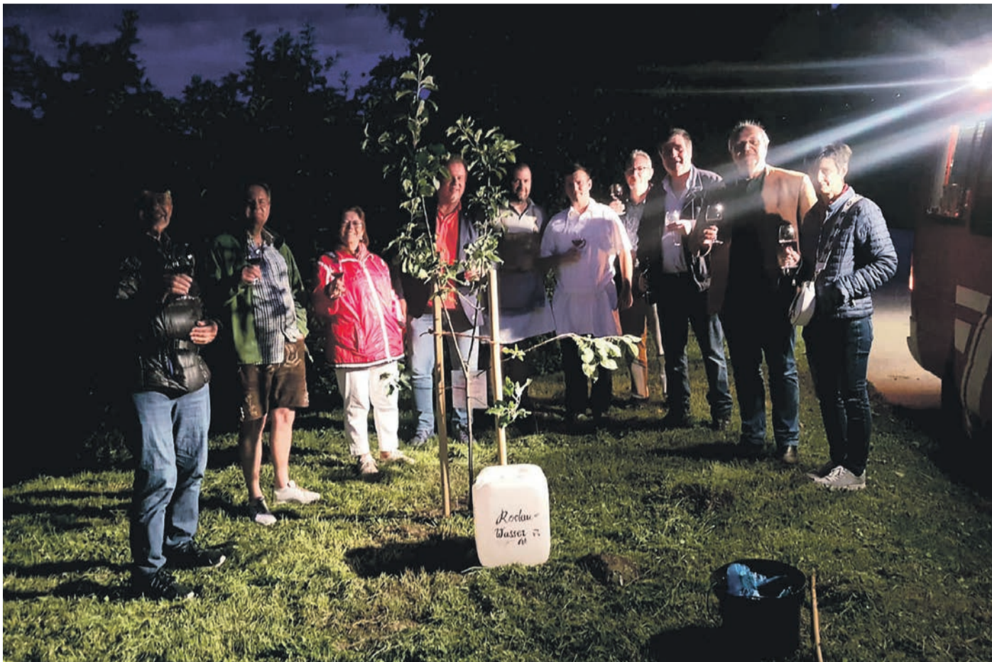
Impressionen der Reise nach Tramin.

Tramin und Rödermark feiern 50 Jahre Städtepartnerschaft / 80-köpfige Delegation reiste nach Südtirol