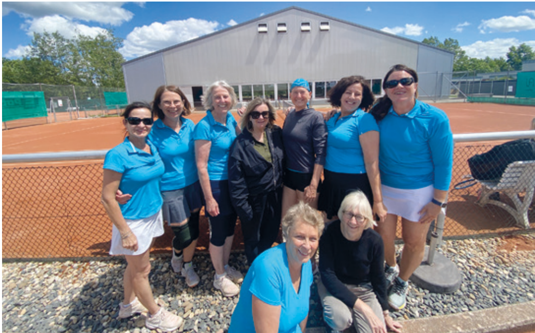
Für eine große Überraschung sorgten die Tennis-Damen 50 der SG Arheilgen mit dem 5:4-Sieg gegen Tabellenführer BW Bensheim.

Tennis-Damen 50 der SG Arheilgen feiern nach hartem Kampf gegen Tabellenführer Bensheim ihren ersten Saisonsieg