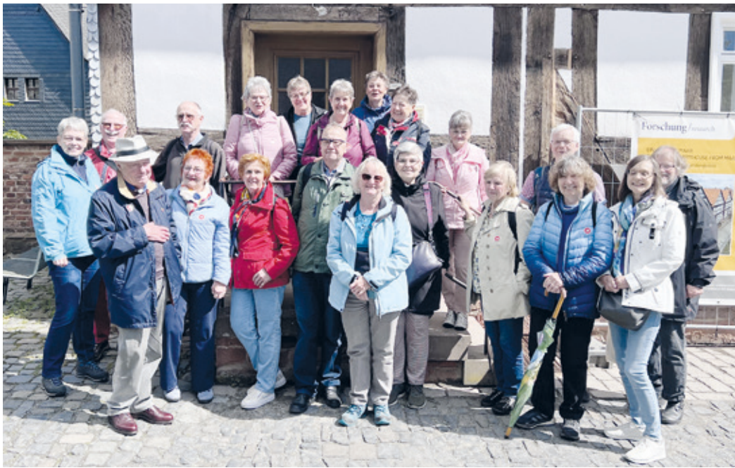
Mitglieder der DRK Aktiven Senioren Wixhausen im Hessenpark Neu Anspach.

(ev) Diesmal nicht zum Einsatz, sondern zu einer Fahrt in den Hessenpark nach Neu Anspach traf sich am 15.06.2024 eine Gruppe aktiver Senioren. Alle sind Mitglieder der Ge-