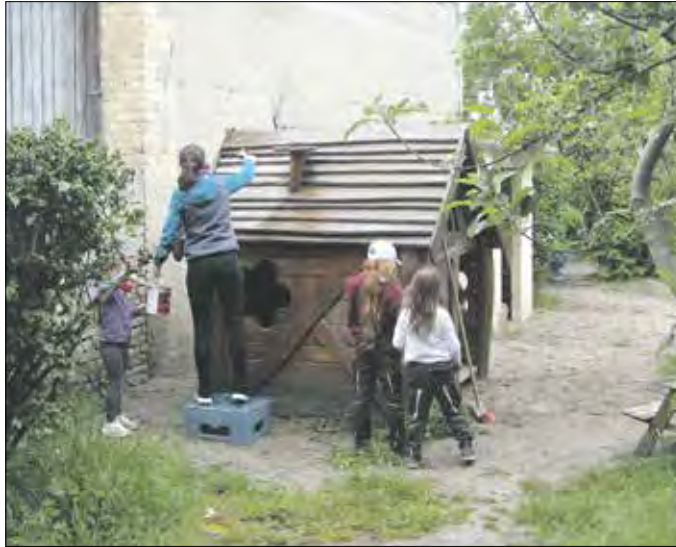
Auch das Spielhaus wurde neu lasiert.

RIEDSTADT – An einem Samstag im Mai trafen sich einige Kinder, Eltern und Erzieherinnen der Kita Sonnenschein in Riedstadt-Erfelden zum Garten-Fit-Tag. Wie in den vergangenen Jahren wurde das Außengelände der Kita auf Vordermann gebracht.