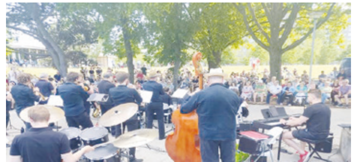
Musik Am See mit der TU-Big Band 2023

Musik Am See: Am Sonntag, 07. Juli, 16 Uhr auf der Seebühne am Ufer des Brentanosee