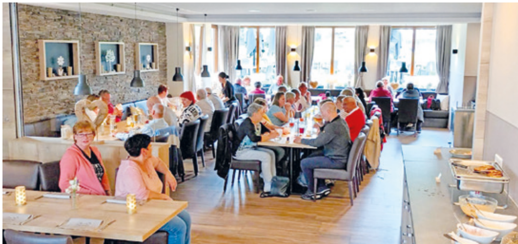
Die Wixhäuser Ausflügler genossen das Reibekuchenbuffet im Restaurant des Landhotels Ewerts im kleinen Ahrtalort Insul.

Wixhausen (kw). Nach einer schönen Busfahrt mit dem Busunternehmen Millireisen erreichten die Wixhäuser VdKler/innen den Treffpunkt mit der Reiseleiterin Tineke von Golen. Anschließend ging die Fahrt vorbei am Nürburgring nach Insul im Landkreis Ahrweiler. Dort war man Gast im Landhotel Ewerts, das in dritter Generation geführt wird. In den neu gestalteten Räumen konnte man sich bei einem reichhaltigen und besonders leckerem Reibeku-