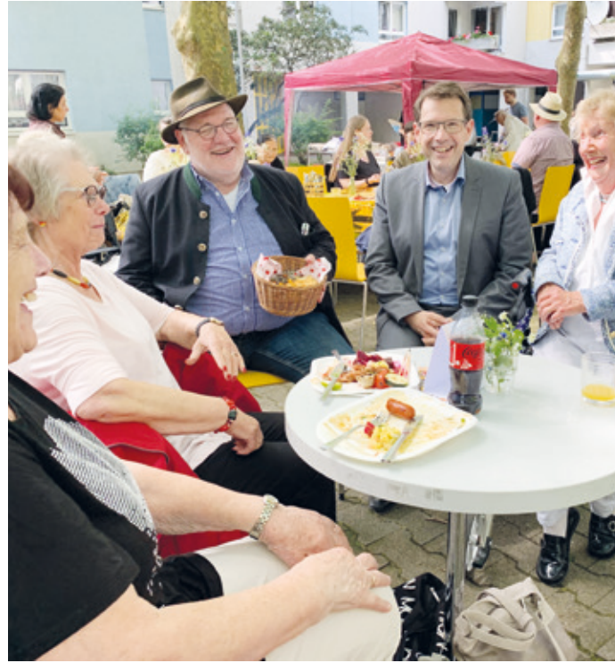
Im Gespräch im Stadtteil Eberstadt Süd.

„Im Juni 2023 hat meine Amtszeit begonnen, und schnell stellte sich heraus, dass die Herausforderungen vielfältig sind. Die strukturellen Probleme der Verwaltung, die IT-Ausstattung und besonders die desaströse Haushaltslage – da habe ich mir zu meinem