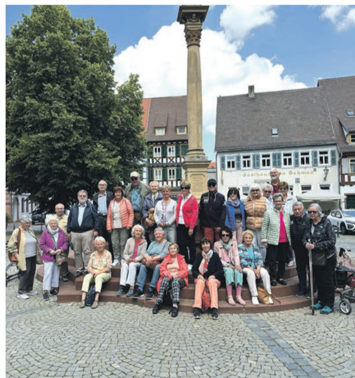
Die Reisegruppe der Senioren-Union der CDU vor dem Marktplatzbrunnen von Ladenburg.

Sollte man eine Beratung im eigenen Zuhause oder außerhalb des gewohnten Rhythmus benötigen, bitte kurz das Anliegen mitteilen. Eine Mitarbeiterin oder einer der Ehrenamtlichen selbst setzen sich dann für eine Terminvereinbarung in Verbindung. Übrigens; für Donnerstag, 27. Juni, können noch Termine für die Digitalberatung im Rathaus, Mozartstraße 8, vereinbart werden.