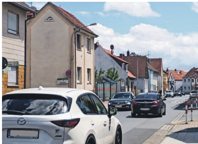
Die Umgestaltung der Fahrbahn und der Bürgersteige in der Hauptstraße ist gerade Thema in Eppertshausen. Die Umsetzung wird aber wohl noch vier bis fünf Jahre auf sich warten lassen.

Eppertshausen (micha) - Als 2010 der Kreisverkehr vor der katholischen Kirche fertiggestellt wurde, empfahl der damalige Landrat Alfred Jakobek, die Umgestaltung der Hauptstraße gleich anzuschließen. „Er meinte, dass noch Gelder in Wiesbaden vorhanden sind“, erinnert sich Bürgermeister Carsten Helfmann. Allerdings ließ sich das Vorhaben dann doch nicht verwirklichen. Seit drei Jahren ist die Gemeinde Eppertshausen nun wieder verstärkt dran, die Neugestaltung der 1,5 Kilometer langen Durchfahrt zu forcieren. Neben den Vorlagen im Bau- und Umweltausschuss stand dazu jetzt eine Bürgerversammlung im kleinen Saal der Bürgerhalle an. Fast bis auf den letzten Platz gefüllt, lauschten je zur Hälfte Anlieger und andere Eppertshäuser, was mit „ihrer“ Hauptstraße passieren soll. Die möglichen Gestaltungsvarianten beschäftigten sich ausschließlich mit einer modernen Straßenführung und nicht mit der Gesamtopitik, die es aufgrund unattraktiver Hausfassaden bereits ins Hessenfernsehen schaffte. Wie Ewald Gillner, Vorsitzender der Gemeindevertretung, sagte, wolle man transparente Politik machen. Das aufgenommene Meinungsbild der Bürger werde