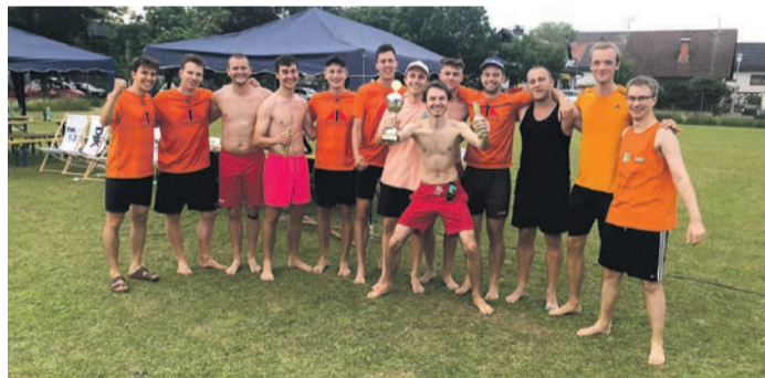
Die drei erstplatzierten Teams mit dem Siegerpokal.