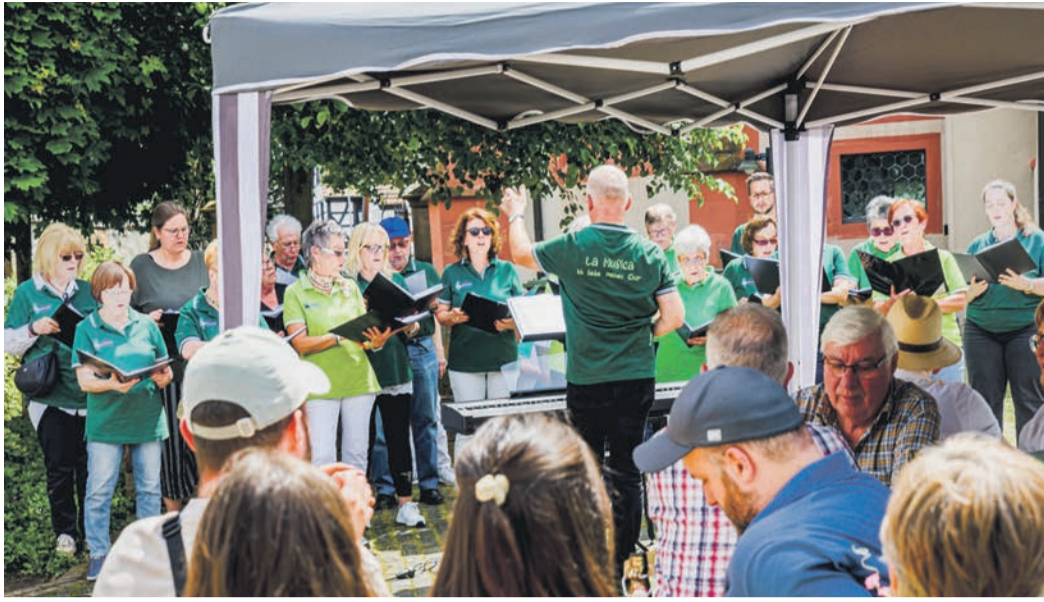
Der Chor „La Musica“ des MGV Altheim beim Auftritt.