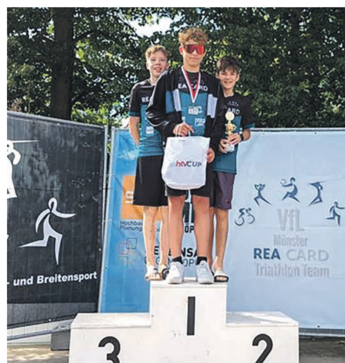
B-Jugend des VfL auf dem Siegereppchen.

Dadurch wurde die legendäre Radstrecke (900 Höhenmeter) über Schaafheim, Mömlingen, Dorndiel (2 Runden) nach Altheim ins Programm genommen. Bis 1992 wurde der Moret über die Olympischen Distanz durchgeführt. Danach wurde auf die Mitteldistanz gewechselt: 1,9 km Schwimmen - 84 km Radfahren - 21 km Laufen im Altheimer Wald. Ab der 35. Auflage des Moret in 2019 kehrte die Olympische Distanz zurück und erweiterte das Renn-Programm. Ab 2020 war Start- und Zielpunkt das Gelände am Hardtsee. Erstmals wurde zusätzlich ein Sprintrennen ausgetragen. Ab 2021 waren dann auch Rennen für Jugendliche und Schüler dabei. In 2023 musste aufgrund von Genehmigungsproblemen das Schwimmen vom Hardtsee in das Sportbad in Dieburg verlegt werden. Daher wurde der Moret erstmalig als reines Sprintrennen ausgetragen: 275 m Schwimmen - 19 km Radfahren - 3 km Laufen. Mehrfach vergab der Hessische Triathlon Verband (HTV) die Durchführung von Hessischen Meisterschaften an den VfL, die in das Renngeschehen des Moret eingebunden wurden. Kürzlich standen bei der 40. Auflage des Triathlon-Klassikers 615 Athleten in 11 verschiedenen Rennen an der Startlinie