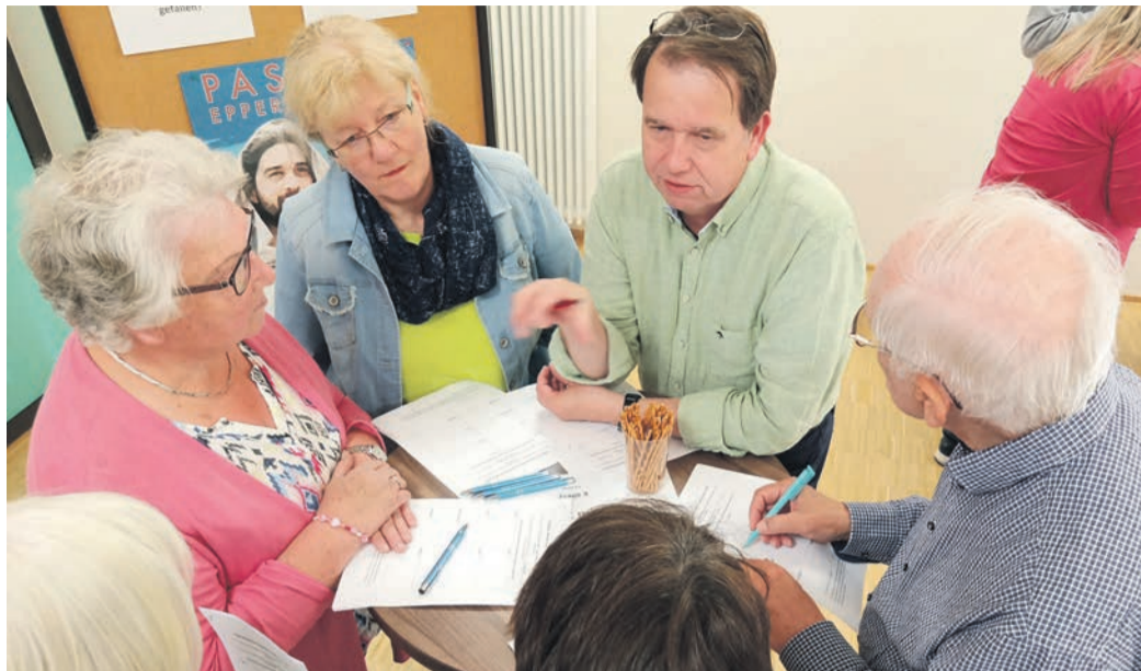
Bei der Nachbesprechung wurde fleißig notiert und diskutiert, was gefiel und was nicht.