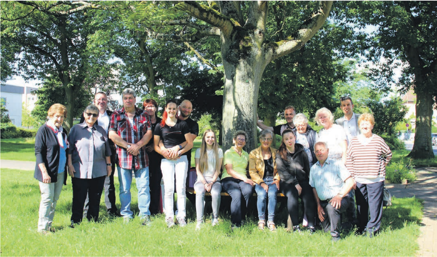
Miteinander verbunden: Zum gemeinsamen Foto hatten sich Vertreterinnen und Vertreter der Partnerstädte Laakirchen und Meiningen sowie der Stadt Obertshausen im Park neben dem Rathaus Schubertstraße aufgestellt.