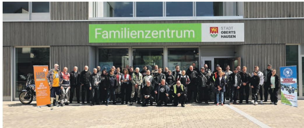
„Fellows Ride“ in Obertshausen

Am Freitag lief der Film „Ride don't Hide“ im Familienzentrum. Es waren wenige, aber dafür sehr interessierte und im Nachgang zufriedene Besucher dort.