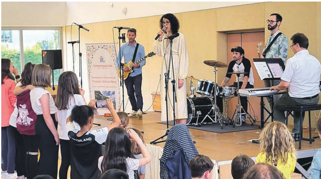
Aufgrund des unbeständigen Wetters fand das Konzertprogramm in der Turnhalle statt, die rechtzeitig zum Beginn der Veranstaltung auch sehr gut gefüllt war.