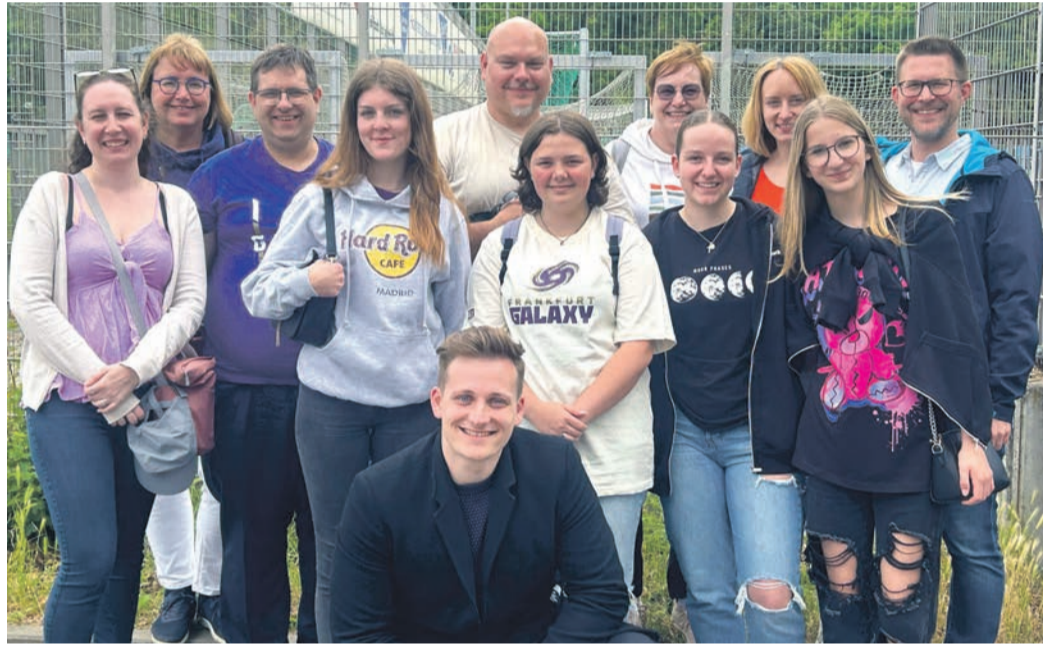
Die Teilnehmer*innen beim Football-Seminar der Hessischen Stenografenjugend und des ZVB Obertshausen 1964.

Nach dem Frühstück ging es ins Stadion zur PowerParty. Hier traf ein Teil der Gruppe auf das Maskottchen der Frankfurt Galaxy während man sich auf das Spiel einstimmte. Im Anschluss wurde das spannende Spiel zwischen der Frankfurt Galaxy und den Wroclaw Panthers auf überdachten Sitzplätzen verfolgt. Auch während des Spiels wurden die Fragen der Football-Neulinge