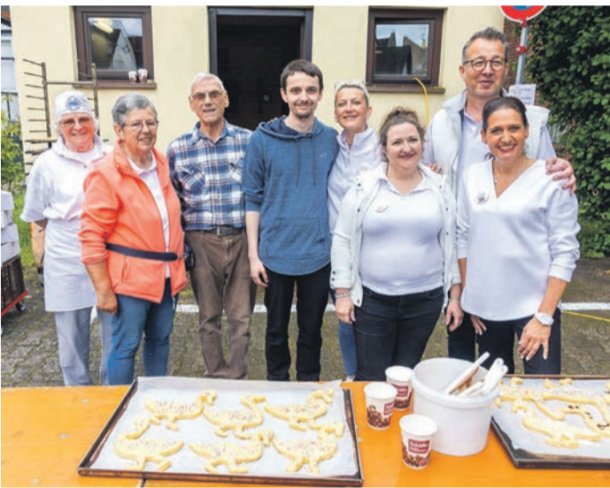
Foto links: In bewährter Weise war das Team der Bäckerei Schäfer wieder beim diesjährigen „Backtag für Kinder“ dabei. Ohne sie wäre diese Veranstaltung schon jahrelang nicht möglich. Die Kinder freuen sich jedes Jahr riesig über die Veranstaltung.