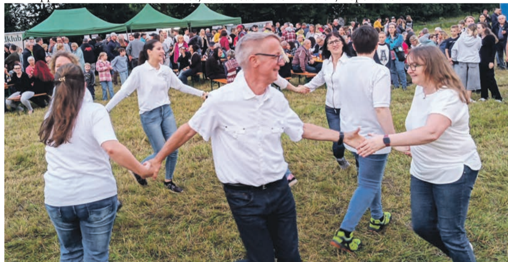
Die Tanzgruppen des OWK zeigten von Groß bis Klein, was sie in ihren Übungsstunden einstudierten.

habe man dann aber durch den Muna-Brand sein gelassen. „Es passte durch den damals sehr trockenen Sommer und die vielen Einsätze der Wehr einfach nicht zusammen“, so Anton. Auch in diesem Jahr waren zur Sicherheit über ein halbes Dutzend Feuerwehrkräfte da, die sich aber aufgrund der nahezu nicht vorhandenen Gefahr durch Funkenflug gemütlich zurücklegen konnten. Stattdessen lag eher die Angst vor, dass die Baumstämme vielleicht nicht brennen, weil das Holz durch den zweitägigen Aufbau - trotz Plane - nass wurde. Die Angst war unbegründet: Die Flammen schossen wie gewohnt meterhoch in den Himmel und lieferten das erwartete Spektakel.