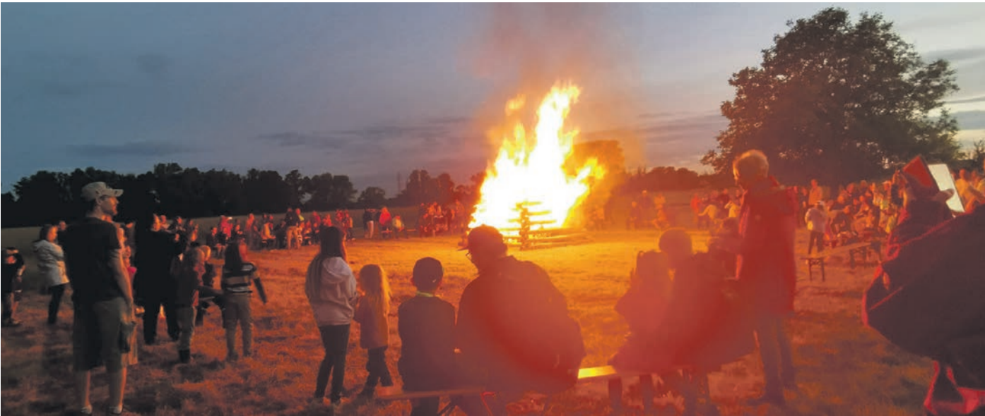
Die Sonnenwendfeier des OWK erfreut sich alljährlich großer Beliebtheit. Auch jetzt zog das Fest die Besucher an - und das trotz grauer Wolken am Himmel und einer nassen Wiese.

Eppertshausen (micha) Manchmal täuscht die Optik: Was vor allem bei den jüngsten Besuchern wie eine Gummistiefel-Parade wirkte, war dann doch die Sonnenwendfeier des OWK.