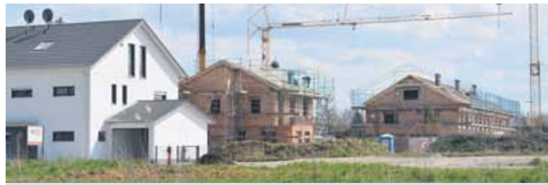
Wer neu baut oder eine Modernisierung plant, findet im Ratgeber nützliche Informationen zu soliden Außenwänden.

Mit dem 100-seitigen Ratgeber können sich Bauherren, Modernisierer und interessierte Mieter umfassend