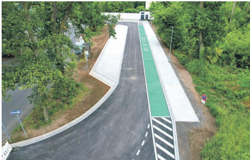
Der neue Kiss&Go-Parkplatz von oben.

Die Kiss & Go-Schleife ist als Einbahnstraße ausgeschildert. Der grüne Kiss&Go-Parkstreifen entspricht einer Länge von acht Parkplätzen. Eine grüne Markierung wird immer dann angewandt, wenn von der Regelnutzung einer Parkfläche abgewichen wird. Im Fall des Kiss & Go-Parkplatzes dient