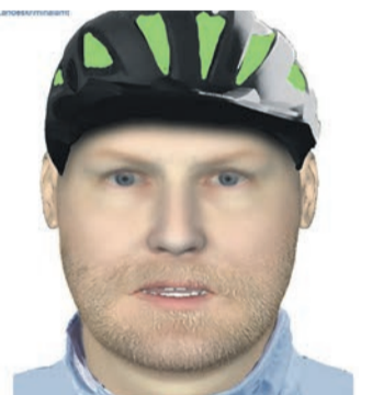
Phantombild des mutmaßlichen Täters.

Die Ermittler fragen nun: Wer kennt Personen, die dem Phantombild ähnlich sehen? Wer hat Kenntnis von der Tat und kann Angaben zum mutmaßlichen Täter machen? Hinweise nehmen die Kriminalpolizei Offenbach unter der Rufnummer 069/8098-1234 oder jede andere Polizeidienststelle entgegen.