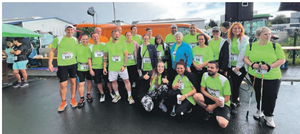
Bei der elften Auflage des Gewerbelaufs, organisiert vom RehaPoint Obertshausen hat auch ein Laufteam der Stadt Obertshausen teilgenommen. Gelaufen wurde für den guten Zweck und die Erlöse des Laufs gingen an die Clown Doktoren, die Stiftung schwerstkranker Kinder Bärenherz und die Kinderhilfestiftung.

Alldrink, Edeka, LIDL, Netto, Norma, Oktoberfest, Penny, Rossmann, Toom Baumarkt