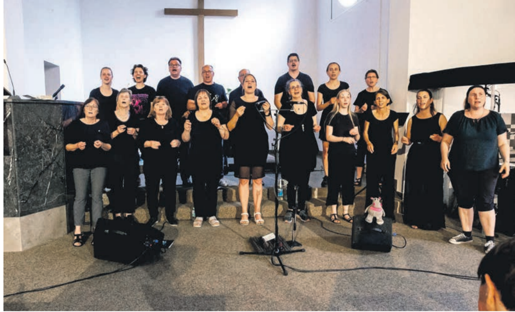
Der Gospel- & Worship-Chor bot ein gelungenes Konzert zum Abschluss.

Auch die für die Unterhaltung der Kinder war durch den