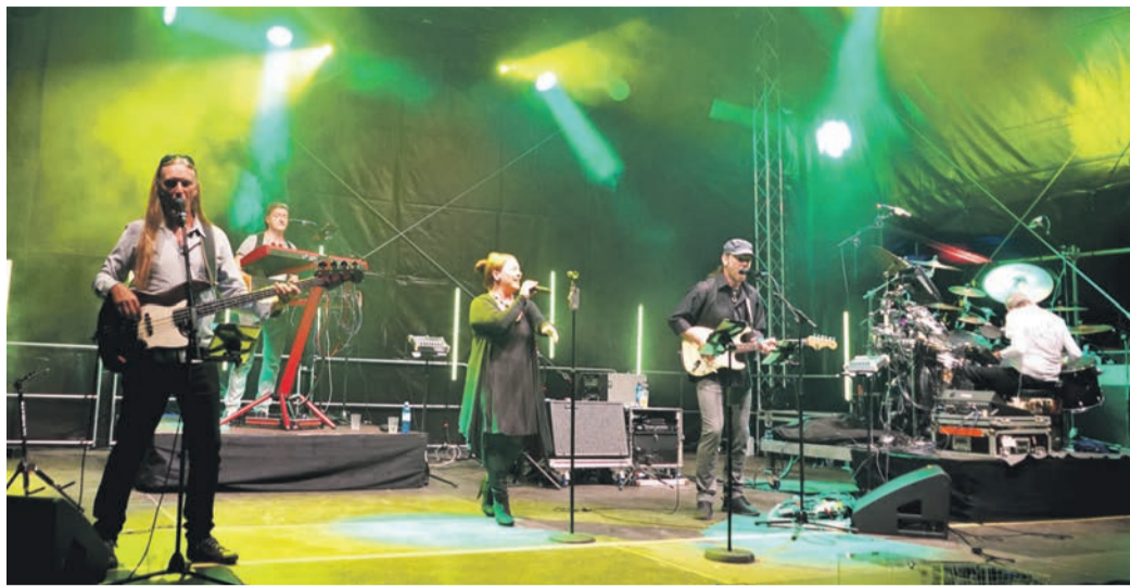
Die Band The Gypsies gastiert im Rahmen des Kultursommers wieder in Obertshausen. Am 13. September rocken sie im Beethovenpark.

Jacqueline Feldmann würde wahrscheinlich noch immer gemütlich auf einer Wiese liegen mit einem Tetra Pak un-