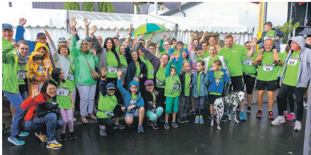
Größte Gruppe und Gewinner des Wanderpokals: die Birkenwald Apotheke.