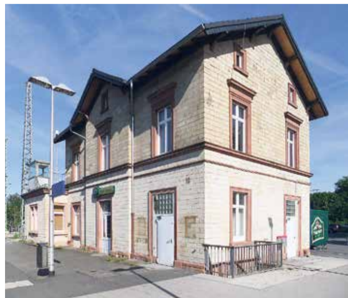
Empfangsgebäude des Bahnhofs Stadion.