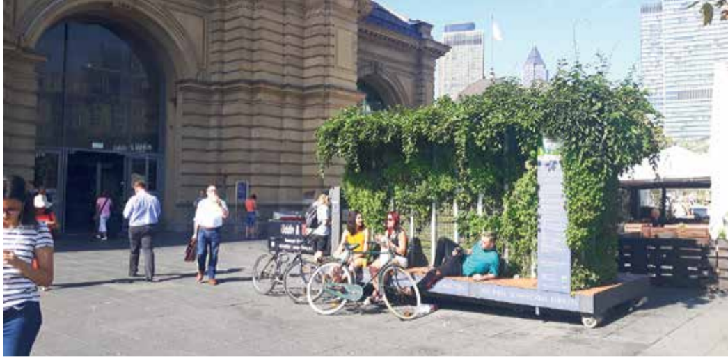
Mobile Inseln: Die Grünen Zimmer werben auch mal auf dem Bahnhofsvorplatz für Klimaschutz in der Stadt.

durch ein grünes Pflanzdach. Seitdem stehen die grünen Installationen jeden Sommer auf geeigneten Plätzen in ausgewählten Stadtteilen. „Anfangs waren viele skeptisch“, erinnert sich Heilig. „Aber die positive Wirkung und die Resonanz auf die Mobilen Grünen Zimmer aus den verschiedenen Stadtvierteln haben uns motiviert, weitere anzuschaffen. Die neu geschaffenen Klimatöpfe machen diese Investition möglich.“ Ziel ist es, künftig für jeden Ortsbeirat ein Grünes Zimmer bereitzustellen. „Die mobilen Grünen Zimmer sind kein Ersatz für begrünte und beschattete Plätze. Das ist klar“, betont Heilig. „Aber sie sind ein sinnvoller Zwischenschritt. Nach und nach werden wir die Frankfurter Plätze klimaangepasst umplanen und entsiegeln. Mit dem Luisenplatz und dem Paul-Arnspberg-Platz haben wir den Anfang gemacht. Goetheplatz, Riedbergplatz, Atzelbergplatz und andere werden folgen.“