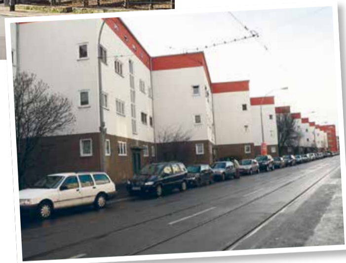
Blick aus der Bruchfeldstraße von Osten.