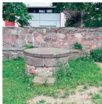
Der historische Nieder Brunnen.

Die evangelische Paul-Gerhardt-Kirche, auch bekannt als Kleine Kirche Niederrad, ist ein barockes Gotteshaus und ein hessisches Kulturdenkmal. Sie wurde 1726 errichtet und diente nach den Zerstörungen im Zweiten Weltkrieg als ein wichtiges Symbol des Wiederaufbaus. Die