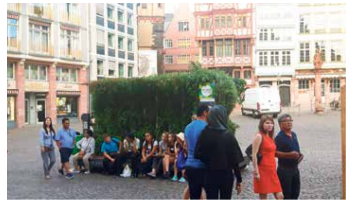
Ob vor dem Frankfurter Römer oder auf dem Rathenauplatz: Das Interesse an den Grünen Zimmern ist groß.