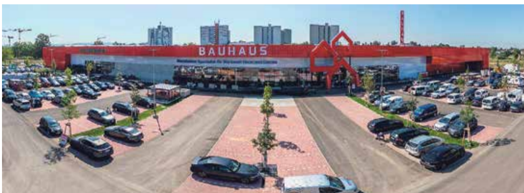
Das neue BAUHAUS bietet reichlich Platz für 160.000 Qualitätsprodukte.