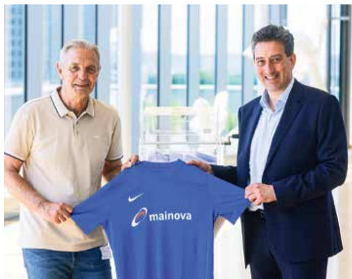
Gewinnerverlosung der Mainova-Trikot-Aktion 2024.

Weitere Informationen unter: www.mainova-aktionen.de/trikots