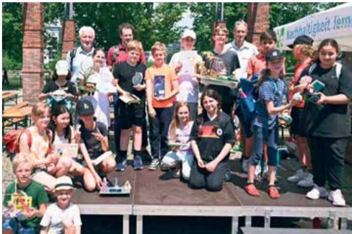
Preisverleihung des Solarrennen 2024.

800 Schülerinnen und Schüler treten mit selbstgebauten Solarflitzern an