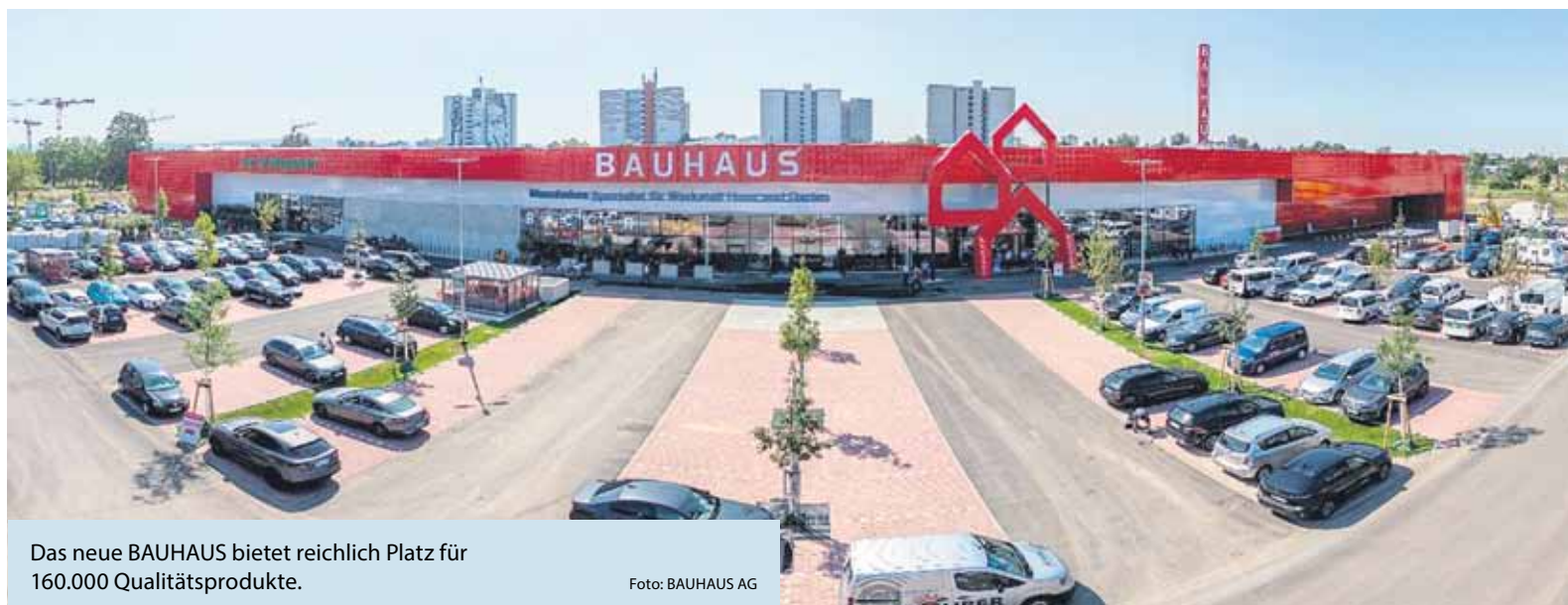
Das neue BAUHAUS bietet reichlich Platz für 160.000 Qualitätsprodukte.