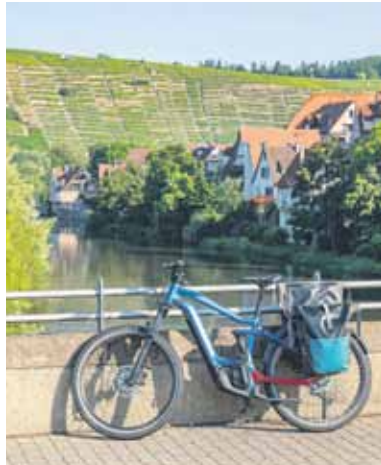
Der Neckartal-Radweg führt durch malerische Weinorte wie Besigheim.

(DJD-K). Erstmals gibt es für den Neckartal-Radweg und den Württemberger Weinradweg eine gemeinsame Erlebniskarte. Das ist für alle Radurlauber auf den beiden 4-Sterne ADFC-Qualitätsradrouten ebenso praktisch wie anregend, egal ob sie zu sportlichen Etappentouren oder zu gemütlichen Tagesausflügen aufbrechen. Während der Neckartal-Radweg dem Flusslauf ohne viele Steigungen folgt, von der Quelle bei Schweningen über Tübingen, Marbach und Heidelberg bis zur Mündung in den Rhein, zweigt der Württemberger Weinradweg in mehreren Schleifen über die umliegenden Weinberge ab. Bei Heilbronn trennen sich die zwei Fernradwege und Radreisende können sich entscheiden, ob sie dem Neckar gen Norden folgen oder ostwärts durch die vielfältigen Weinregionen Württembergs fahren bis nach Niederstetten im Lieblichen Taubertal. Dank beidseitiger Beschilderung geht es auch umgekehrt.