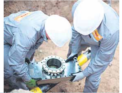
Planen, Absperren und Anbohren: Die e-netz Südhessen ist Experte für die fachgerechte und zeitsparende Stoppelung von Gashochdruckleitungen ohne Versorgungsunterbrechung.