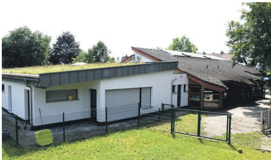
Der Evangelische Kindergarten in Alheim, fotografiert vom Hügel des benachbarten Spielplatzes aus. In den kommenden Wochen wird die Einrichtung weitgehend verwaist sei, weil das Dach saniert wird. Der Ausweichstandort steht bei den Eltern in der Kritik.