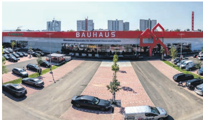
Das neue BAUHAUS bietet reichlich Platz für 160.000 Qualitätsprodukte

MANNHEIM (SH) Das neue BAUHAUS Fachzentrum in Mannheim-Columbus hat am 28. Juni seine Türen geöffnet und ersetzt somit das kleinere BAUHAUS Vogelstang. Mit rund 19.000 Quadratmetern Fläche bietet es 6.500 Quadratmeter mehr Platz und ein völlig neues Verkaufskonzept. Neben besonderen Services wie der Drive-In ARENA, einer Abholstation und einem Gasflaschenautomat, liegt der Fokus auf Nachhaltigkeit: Schnellladestationen für Elektroautos, energiesparende LED-Lampen und eine Photovoltaik-Anlage gehören zur Ausstattung. Das BAUHAUS Mannheim bietet über 160.000 Produkte und setzt auf ein nachhaltiges Energiekonzept, einschließlich begrünter Dächer und Wärmepumpen. Kunden können Produkte online reservieren und vor Ort abholen. Mit zentraler Lage und guter Anbindung an die B38 bietet es optimale Erreichbarkeit. Das Fachzentrum und die dazugehörige Drive-In ARENA haben künftig von Montag bis Samstag von 07:00 - 20:00 Uhr geöffnet.