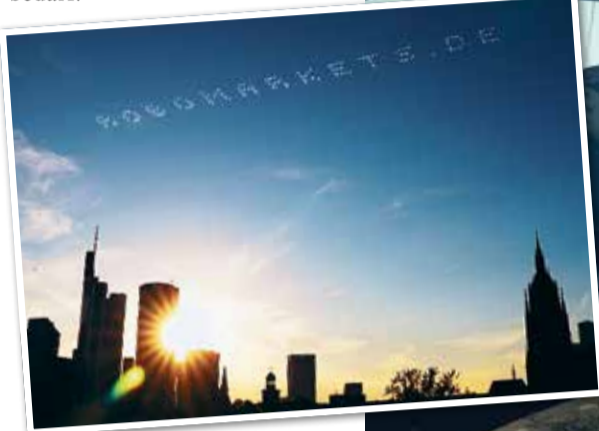
„ROBOMARKETS“ als AirPrint am Himmel über der Skyline.