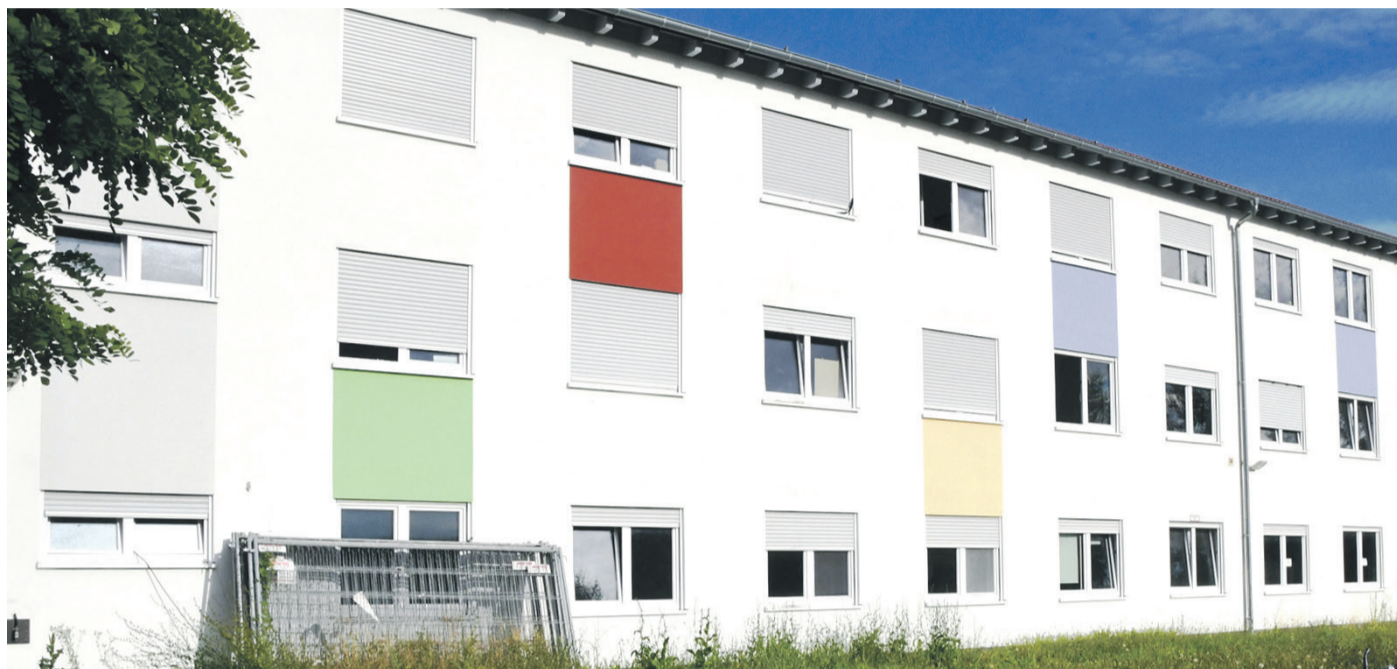
Recht verwahrt ist das Außengelände am Asylbewerber-Wohnheim in der Münsterer Goebelstraße. Gesetzlich gewollt ist eigentlich, dass die Bewohner die Einrichtung möglichst selbst aufrechterhalten. In Münster will vor allem die CDU darüber hinaus, dass Asylbewerber gemeinnützige Arbeit im Ortsgebiet leisten.