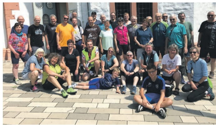
Die Wallfahrtsgruppe vor der Martinskirche in Nierstein.

Es war bereits nach halb elf Uhr, bis die nächste Auszeit im Hartenauer Hof mit einer Kaffeepause anstand. „Das Gute sehen“, hieß es jetzt im Text der