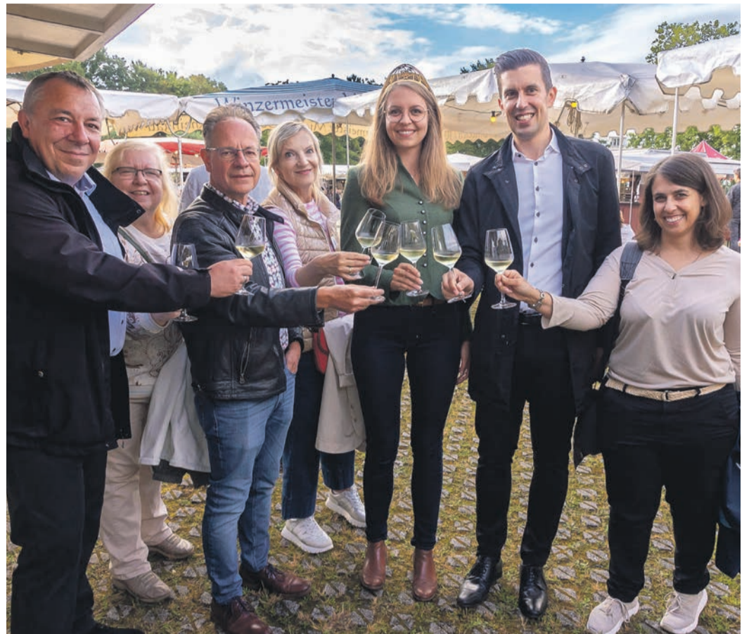
Das erste Gläserklingen mit der Weinkönigin.