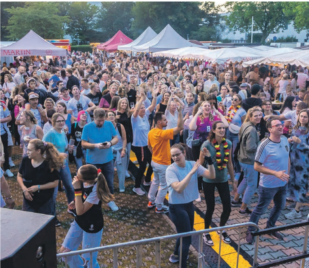
Beste Stimmung herrschte am Freitag bei der Band „Doctor Blond“.

Unabhängige Wochenzeitung und Nachrichten aus und für Obertshausen