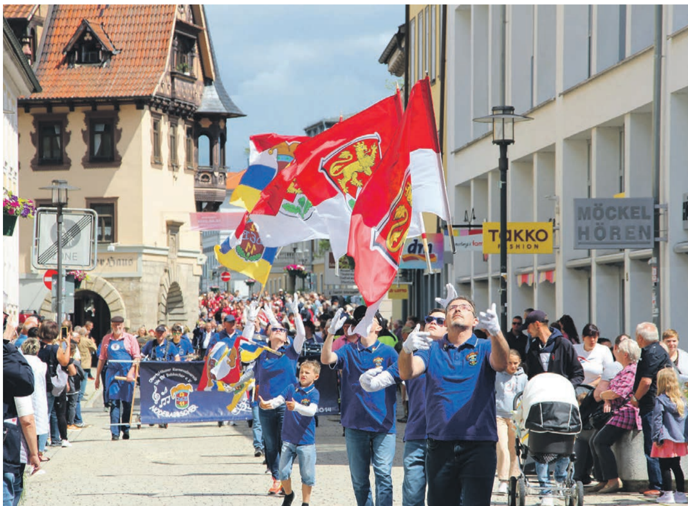
Mit den Nodebabbschern und den Fahenschwingern reiste der 1. ObertsHäuser Karnevalsvereins „Die Elf Babbscher“ nach Meiningen. In Obertshausens Partnerstadt nahmen sie am Umzug anlässlich des Hütessesfestes teil.