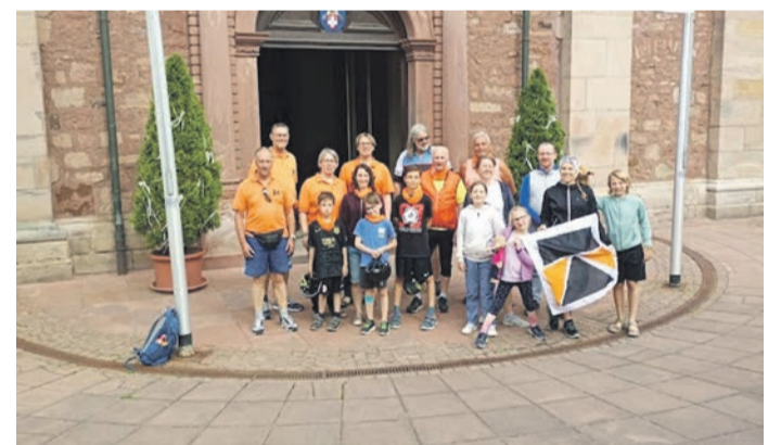
Die Teilnehmer vor der Basilika in Walldürn.

Nach einem Abschlussgebet in Stockstadt ging es weiter zum Tagesziel nach Großwall- stadt. Dort wurde das Gepäck aus dem Begleitfahrzeug in Empfang genommen und die