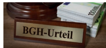
Starkes Urteil für Versicherte.

sind viele Versicherungsverträge auch heute noch anfechtbar. Man nennt dies „ewiges Widerrufsrecht“. Bei einem Widerruf erhalten Sie, anders als bei der Kündigung, alle eingezahlten Beiträge ohne Abzug von Maklerprovisionen und Verwaltungskosten zurück.