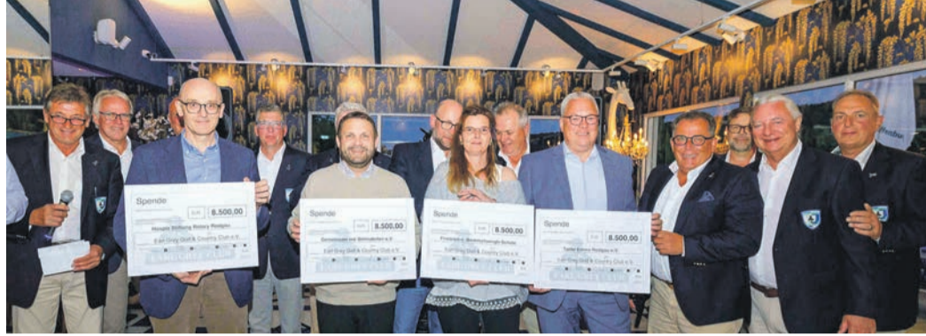
Die Überreichung der Spenden an die begünstigten Rodgauer Organisationen von insgesamt 36.000,00 Euro, war ein Höhepunkt des Abends.

Wer mit seinen golferischen Leistungen auf den bestens präparierten Fairways und Grüns nach dem ersten neun Loch nicht zufrieden war, konnte sich mit hervorragender Rundenverpflegung und Service der Veranstalter an der 'Halfway-Terrasse' ablenken und trösten. Als sich gegen 16:30 Uhr mit Beendigung des Turniers die Teilnehmer auf der Club-Terrasse zum 'Come-Together' einfanden, wurden bei kühlen Erfrischungsgetränken und kleinen Snacks gefachsimpelt und die Erlebnisse der Golfrunde aufgearbeitet.