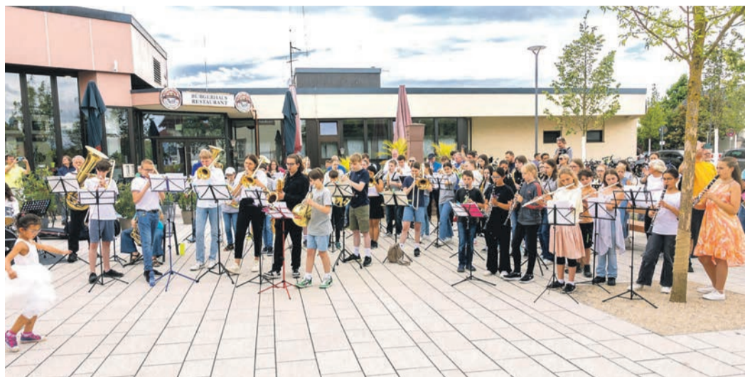
Ein „Flashmob“ aus Bläsergruppen vor dem Bürgerhaus.