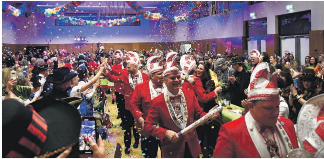
Ein Foto von der FVCA-Sitzung 2024: Der Elferrat lässt Konfetti regnen. Das verbietet die Ordnung der Eppertshäuser Bürgerhalle künftig. Rein dürfen ab August erstmals auch Eventagenturen.

Seit der Einweihung der Bürgerhalle im Januar 2012 war das Eppertshäuser Vereinen, Bürgern und Unternehmen vorbehalten. Klaren Vorrang bei der bislang jährlichen Erstellung des Belegungsplans für den Komplex mit dem großen Saal (mit Bühne und Künstlergarderobe), dem kleinen Saal, dem Thekenbereich mit Küche und Kühlhaus, dem Sanitärbereich sowie dem Foyer mit Garderobe hatten stets die Eppertshäuser Vereine, Schulen, Kitas und Kirchengemeinden. Dies verdeutlichte sich auch in einer kostenlosen Bereitstellung der Halle für diesen Nutzerkreis. Daran ändert sich durch die neue Ordnung nichts. Allerdings soll der Belegungsplan künftig alle sechs Monate und damit doppelt so häufig wie bisher erstellt werden. Für Eppertshäuser Firmen und