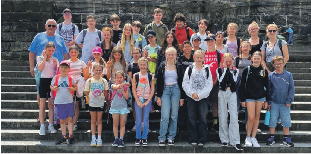
Gruppenfoto am „Deutschen Eck“ in Koblenz