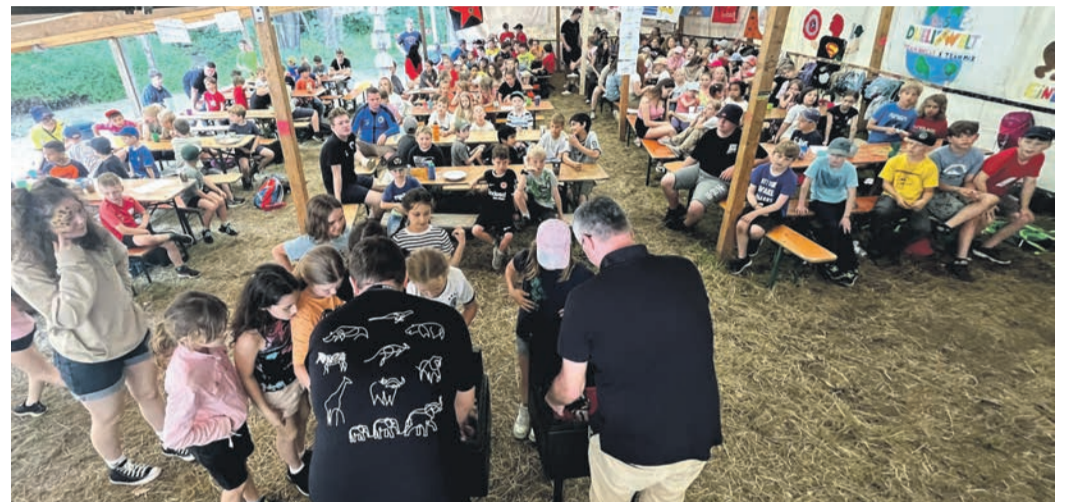
Beim Abschluss der Bulau-Freizeit, mit der Siegerehrung der einzelnen Gruppen, herrschte noch einmal Hochbetrieb.