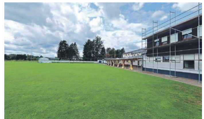
Neben der Vereinshalle und dem Umkleidetrakt gibt es auf dem Vereinsgelände der TG an der Mainzer Straße zwei Rasenplätze.

Ober-Roden (PS) - Auf einer außerordentlichen Mitgliederversammlung bekam der Vorstand der Turngemeinde grünes Licht zur Neugestaltung des Vereinsgeländes. Ein Bauausschuss soll gegründet werden, neben einer Sanierung der bestehenden Gebäude mit einem Erweiterungsbau wird auch das Szenario eines kompletten Neubaus geprüft.