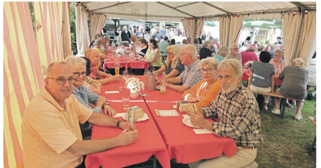
Das Sommerfest des Kleingartenvereins war gut besucht.

Rödermark (NHR) Am Montag, dem 29. Juli lädt die SPD Rödermark wieder Mitglieder und politisch interessierte Gäste zum politischen Stammtisch ein. Der Stammtisch ist ein zwangloses Treffen und findet ab 19 Uhr im TS-Sommergarten, Dr. Walter Kolb-Str., Ober-Roden, statt. Mitglieder und Gäste sind herzlich willkommen.