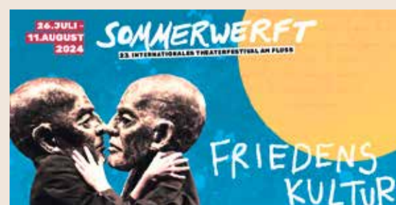
Der offizielle Banner zum Festival.

Vom 26. Juli bis 11. August 2024 verwandelt das Sommerfestival „Sommerwerft“ das Mainufer in einen pulsierenden Kulturfreiraum. Unter dem Motto „Friedenskultur“ setzen Kulturschaffende ein Zeichen gegen Hass und Aggression. Das Festival bietet eine Plattform für Theater, Tanz, Musik und Performance, und schafft Raum für den Dialog und die Begegnung unterschiedlicher Kulturen, Geschlechter und Hintergründe. Ziel ist es, Brücken zu bauen und Gräben zu überwinden, die unsere Gesellschaft durchziehen. Die Sommerwerft steht für Vielfalt und Verständigung und lädt alle dazu ein, gemeinsam eine neue Geschichte zu schreiben.