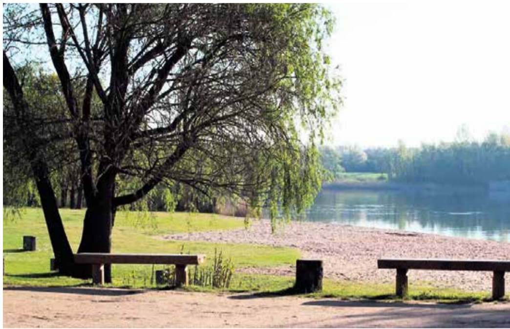
Der Schultheis-Weiher in Offenbach.

HESSEN (SH) | Dieser Sommer bringt nicht nur sonnige Tage und sehr warme Temperaturen, sondern auch eine erhöhte Präsenz von Blualgen in einigen hessischen Badeseen mit sich. Besonders betroffen sind der Wißmarer See bei Wetztenberg und der Schultheis-Weiher in Offenbach. Blualgen, auch als Cyanobakterien bekannt, können sich bei warmen Temperaturen und nährstoffreichen Bedingungen schnell vermehren. Diese Mikroorganismen sind nicht nur unansehnlich, sondern können auch gesundheitliche Risiken mit sich bringen. Badegäste sollten deshalb auf grün-blaue Schlieren im Wasser und einen muffigen Geruch achten, da dies Anzeichen für eine Blualgenblüte sein können.