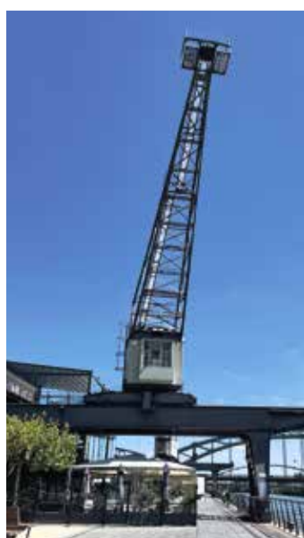
Das Restaurant Oosten mit dem markanten Kran.

Der Hafenpark ist ein Highlight des Ostends und bietet auf vier Hektar ein vielfältiges Freizeit- und Sportangebot. Direkt am Main gelegen, unterhalb des markanten EZB-Gebäudes, finden sich hier Fußball- und Basketballfelder, zwei Fitnessparcours und ein beliebter Skatepark. Besonders an Wochenenden und in den Sommermonaten wird der Hafenpark zum beliebten Treffpunkt. Sportbegeisterte wie Erholungssuchende genießen die hübsch angelegten Grünflächen. Der Hafenpark vereint Sport und Erholung und bietet mit seinen weitläufigen Anlagen und malerischen Grünflächen eine perfekte