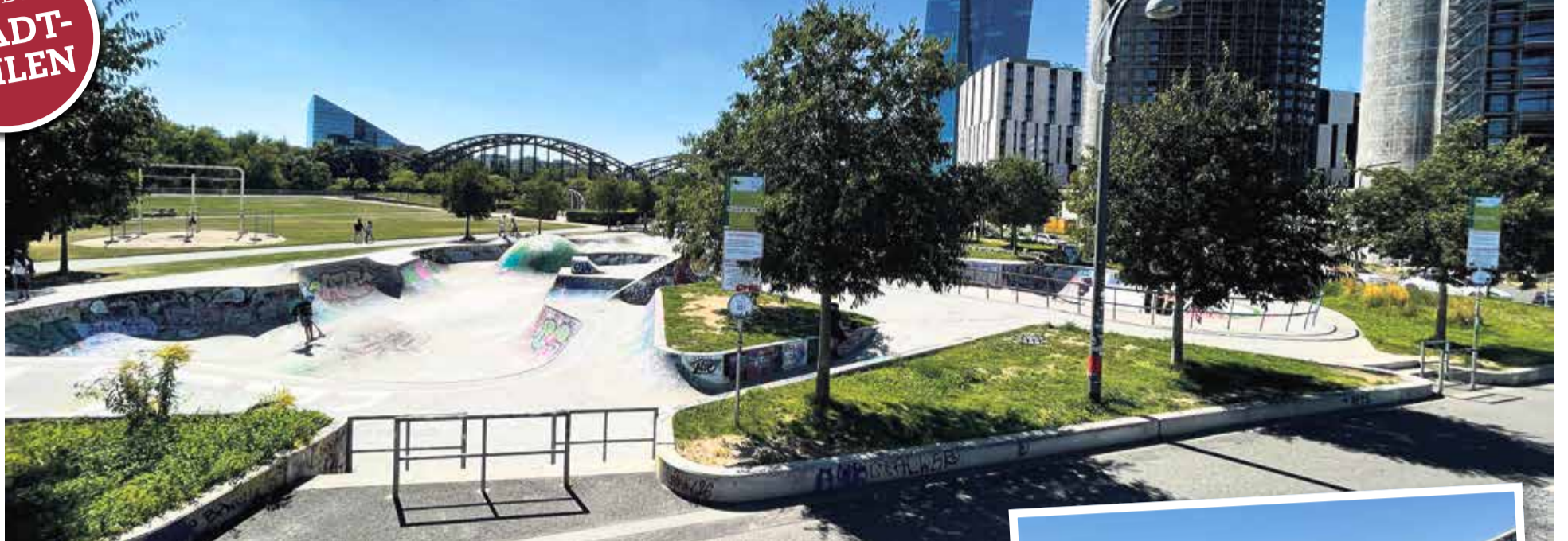
Das weitläufige Freizeit- und Sportgelände des Hafens.

Das Frankfurter Ostend hat eine beeindruckende Entwicklung hinter sich. Einst ein Arbeiterviertel, entstand es im 19. Jahrhundert als östliche Außenstadt und entwickelte sich rasch zu einem Gründerzeitviertel. Heute besticht das Ostend durch seine Lage am Mainufer und bietet einen gelungenen Mix aus urbanem Flair und grünen Oasen. Hier trifft großstädtisches Leben auf erholsame Natur, und die Kombination aus schicken Restaurants, gemütlichen Cafés und einer lebendigen Club- und Barszene zieht viele Besucher an. Auch Künstler finden im Ostend ihre Heimat und prägen den Stadtteil mit Theatern und Bühnen für die Kunst- und Musikszene. Ein umfassendes Bildungsangebot, einschließlich einer Volkshochschule, sorgt für vielfältige Weiterbildungsmöglichkeiten. Dank seiner zentralen Lage und ausgezeichneten Infrastruktur eignet sich das Ostend perfekt für Ausflüge in und um Frankfurt.