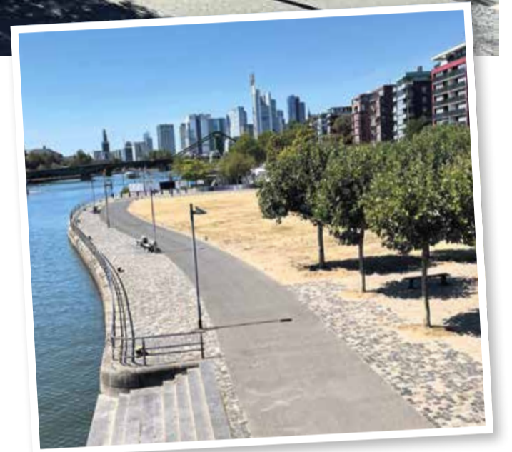
Uferweg so weit das Auge reicht.

Die East Grape Weinbar im Ostend ist ein Paradies für Weinliebhaber. In gemütlichem Ambiente und mit persönlicher Begrüßung durch den Inhaber Ralf Müller-Arnold fühlen sich Gäste sofort wohl. Die vielfältige Weinauswahl, die auch vegane Weine umfasst, wird durch die perfekten Snacks ergänzt. Die East Grape ist mehr als nur eine Weinbar; sie ist ein Ort der Geselligkeit und des Genusses. Mit ihrer charmanten Atmosphäre und der persönlichen Note hat sie sich einen festen Platz in der Herzen der Ostend-Bewohner und Besucher erobert.